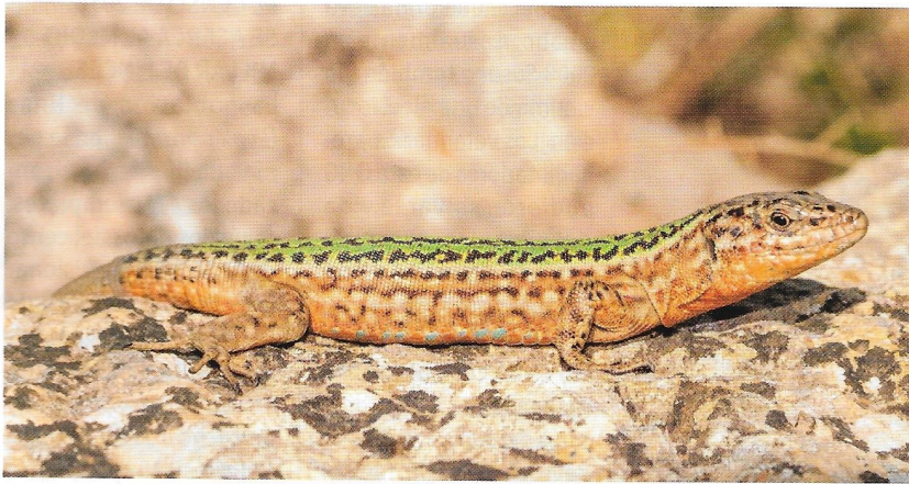
Lagartija de las Pitiusas de la población existente en Ibiza.

Tras ser capturados y éticamente sacrificados, la dieta y la condición corporal de casi trescientos especímenes han sido analizadas por los autores de este artículo en un trabajo recientemente publicado en la revista científica European Journal of Wildlife Research .