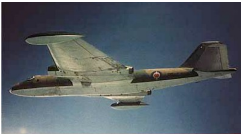
Excelente toma del Canberra de RRAF 214 antes del cambio de insignias y la aplicación del singular camuflaje COIN ilustrado en este artículo.

Modelismo Nro. 5, 1ra. Edición, Rev.5, 14 de Dic 2004