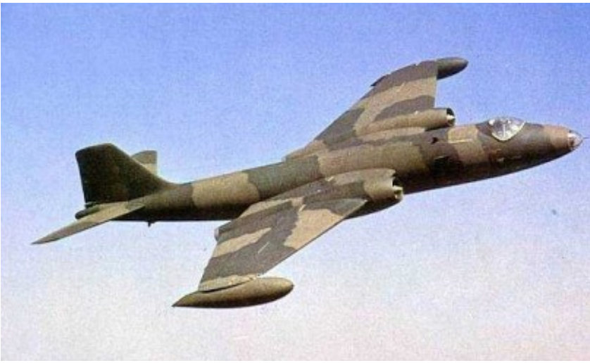
Excelente toma de un Canberra RRAF no identificado desprovisto de toda insignia y marca.