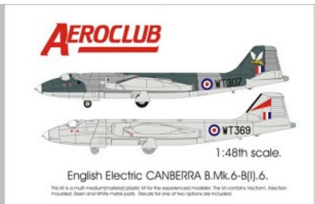
Portada del juego K450 de AEROCUB.