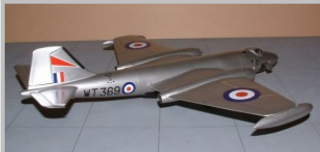
Juego terminado por Darius Aibara