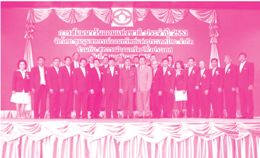
ที่ปรึกษา/ผู้ตรวจและผู้บริหาร ชสอ.ถ่ายภาพที่ระลึกร่วมกับท่านนายกรัฐมนตรี