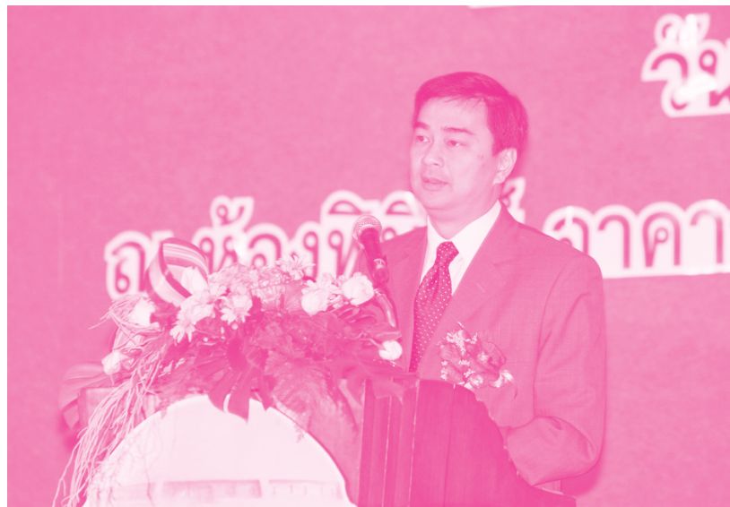
นายกรัฐมนตรี (อภิสิทธิ์ เวชชาชีวะ) เป็นประธานเปิดงาน

เมื่อวันที่ 6 พฤศจิกายน ที่ผ่านมา นายกรัฐมนตรี (อภิสิทธิ์ เวชชาชีวะ) ได้เป็นประธานในพิธีเปิดการสัมมนา “โครงการสัมมนาวันออมแห่งชาติ ประจำปี 2553” ณ ห้องประชุมพีบีทรี อาคาร เอ็กซีutiveเซ็นเตอร์ ศูนย์แสดงสินค้าและการประชุมอิมแพ็คเมืองทองธานี จังหวัดนนทบุรี โดยได้แสดงความขอบคุณ ชสอ. ที่ได้สนับสนุนนโยบายส่งเสริมการออมของรัฐบาล และแสดงความชื่นชมกับสหกรณ์ที่ประสบความสำเร็จในการกระตุ้นให้เกิดการออม และขอให้ขยายผล ขยายเครือข่าย ขยายความรู้ไปสู่สหกรณ์ และชุมชนอื่นต่อไป