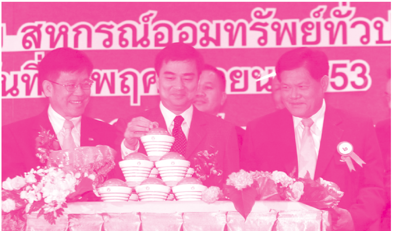
นายกรัฐมนตรี หยอดเหรียญในกระปุกออมสิน