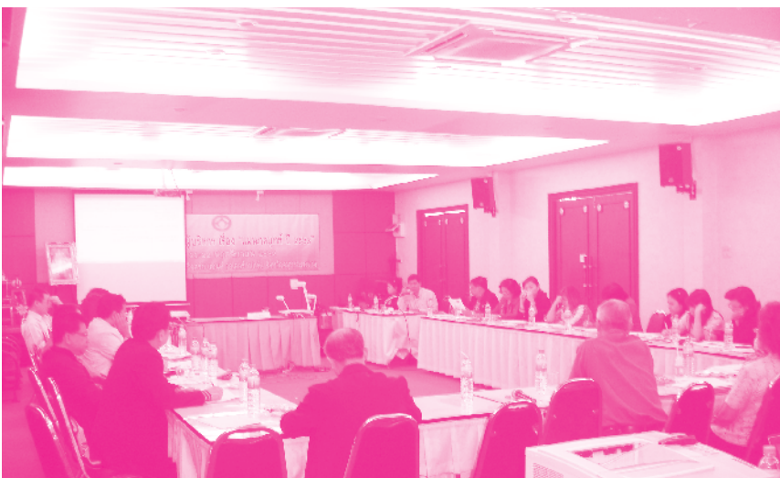
เวทีแลกเปลี่ยนเรียนรู้ระหว่างผู้นำ ชสอ.และผู้ทรงคุณวุฒิ