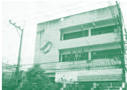
สหกรณ์การเกษตรย่านตาขาว จำกัด