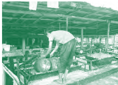
น้ำยางพาราสด