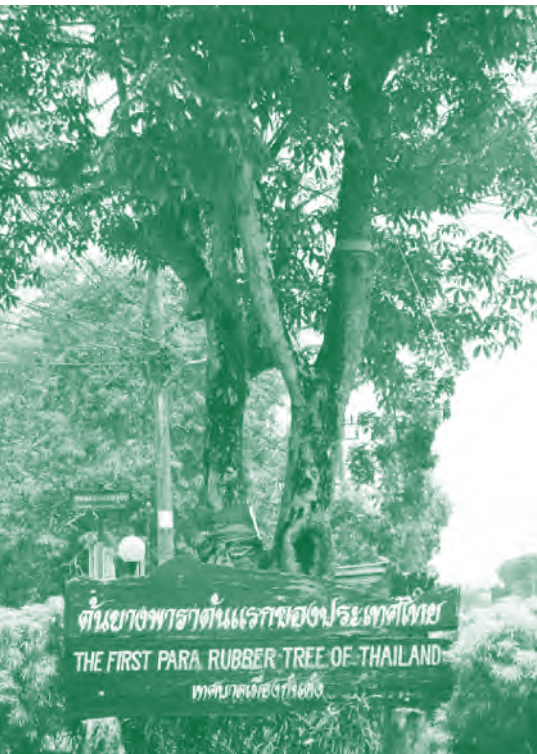
ต้นยางพาราดั้งแรกของประเทศไทย

ละ 100.97 บาท ลดลงต่ำสุดในเดือนธันวาคมปีเดียวกันเหลือ 36.29 บาท ต่อกิโลกรัม จะเห็นว่าผันผวนมาก หลังจากนั้นแต่ละประเทศได้แก้ปัญหาเหตุการณ์ค่อยๆ ดีขึ้น ราคายางพารากลับมีแนวโน้มเพิ่มขึ้น จนเมื่อธันวาคม 2552 สูงถึงกิโลกรัมละ 83.46 บาท และยังมีแนวโน้มเพิ่มขึ้น เพราะภาวะเศรษฐกิจฟื้นตัวประกอบกับขาดแคลนยางพาราในช่วงนี้เนื่องจากภาวะน้ำท่วม ฝนตก