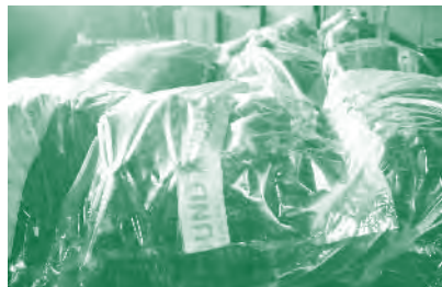
ยางคอมปาวด์ที่ปัจจุบันผลิตโดยกลุ่มเกษตรกรทำสวนธารน้ำทิพย์ อ.เบตง จ.ยะลา

1 ล้านบาทต่อวัน ดังนั้นการทำธุรกิจค้าขายยางพาราจึงต้องลดความเสี่ยงการขาดทุนโดยการรวมตัวเป็นเครือข่ายเพื่อเพิ่มมูลค่าโดยไม่ต้องเพิ่มต้นทุนในการดำเนินการ