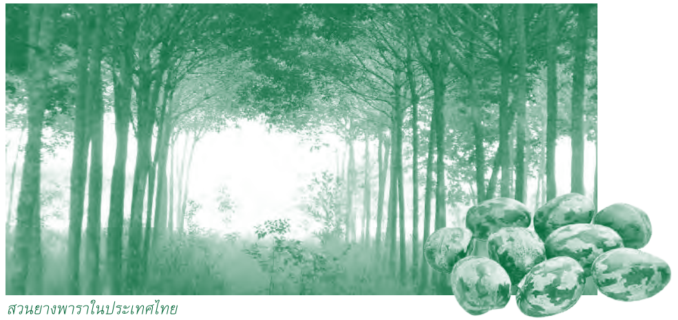
สวนยางพาราในประเทศไทย

ชุก สวนยางเสียหายจากพายุลูก และต่างประเทศยังมีความต้องการมากต้องรีบซื้อเกรงว่าราคาจะเพิ่มขึ้นอีกจึงทำให้มีราคาเพิ่มขึ้นทุกวัน เช่น ในเดือนพฤศจิกายน 2553 เมื่อวันที่ 1 พ.ย. 53 เท่ากับ 112.50 บาทต่อกิโลกรัม เพิ่มขึ้นเป็น 121 บาทต่อกิโลกรัมในวันที่ 11 พ.ย. 53 นอกจากนี้ยังมีปัจจัยอื่นๆ อีกที่กระทบต่อราคา เช่น ราคาน้ำมัน การเก็งกำไร สต็อกยางของประเทศผู้ผลิตและประเทศผู้ซื้อ