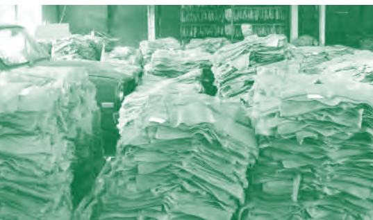
ยางแผ่นรมควัน