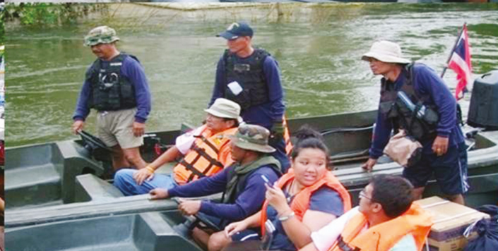
กลุ่มองค์กรที่ไม่แสวงผลกำไร (Non-Profit organization)