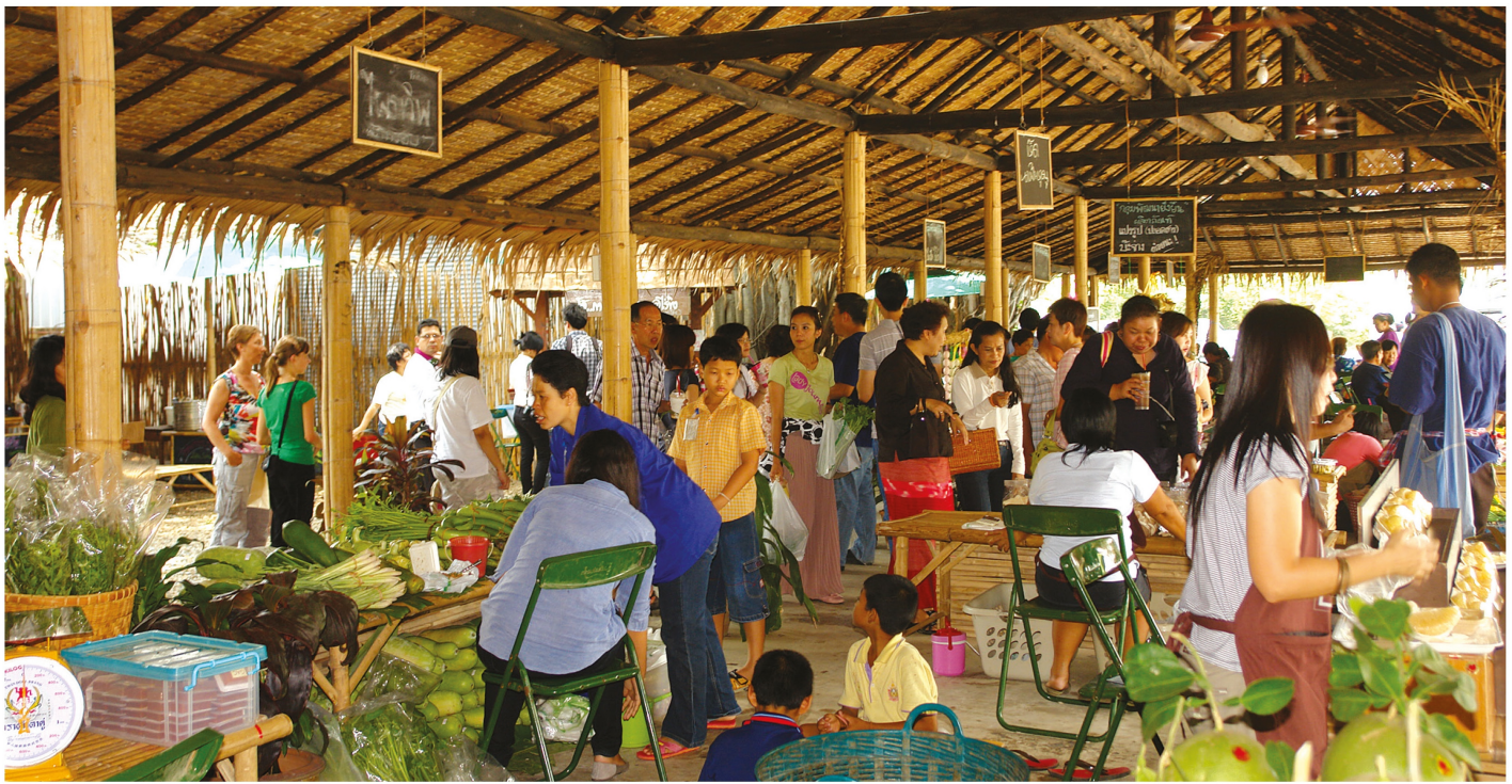
ตัวอย่างธุรกิจฐานสังคม