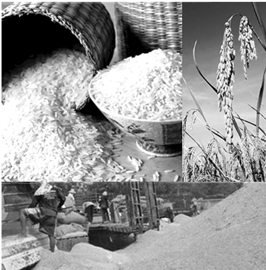
เส้นทางโซ่อุปทานของสินค้าข้าว

สินค้าข้าวเป็นผลิตผลเกษตรที่ค่อนข้างเป็นฤดูกาล โดยทั่วไปในฤดูนาปีจะเก็บเกี่ยวข้าวเปลือกในระหว่างเดือนพฤศจิกายนถึงเดือนกุมภาพันธ์ ขึ้นอยู่กับลักษณะนิเวศวิทยาของแต่ละภูมิภาค จึงเห็นได้ว่าช่วงเก็บเกี่ยวข้าวนาปีในภาคเหนือและภาคตะวันออกเฉียงเหนือจะเก็บเกี่ยวข้าวได้เร็วกว่าการเก็บเกี่ยวข้าวในภาคกลาง การเก็บเกี่ยวข้าวในฤดูนาปรังจะเริ่มจากเดือนมีนาคมจนถึงเดือนสิงหาคม เพราะการปลูกข้าวนาปรังในภาคกลางขึ้นอยู่กับการเก็บเกี่ยวในฤดูนาปีว่าสามารถเก็บเกี่ยวได้เร็วหรือช้า ผลผลิตข้าวเปลือกเมื่อเก็บเกี่ยวแล้วจะถูกกระจายสู่ตลาดทั้งในระดับท้องถิ่นและในระดับภูมิภาค แล้วจึงเข้าสู่กิจกรรมการแปรรูปเป็นข้าวสารโดยโรงสีข้าว เพื่อกระจายต่อไปยังผู้บริโภคและผู้ส่งออก ในระบบการตลาดข้าวจึงประกอบด้วยตลาดข้าวเปลือกและตลาดข้าวสาร ในตลาดข้าวเปลือกผู้มีบทบาทเกี่ยวข้อง ได้แก่ ชาวนาผู้ผลิต ตัวแทนพ่อค้าในท้องถิ่น พ่อค้าผู้รวบรวมในระดับต่างๆ สถาบันเกษตรกร ท่าข้าว/ตลาดกลางข้าวเปลือก และโรงสี ในตลาดข้าวสารผู้มีส่วนเกี่ยวข้อง ได้แก่ โรงสี หยง พ่อค้าขายส่งและปลีก ผู้ส่งออก และผู้บริโภค ตลอดจนหน่วยงานสนับสนุนต่างๆ