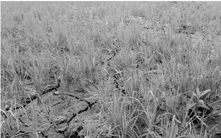
ปัญหาความแห้งแล้ง