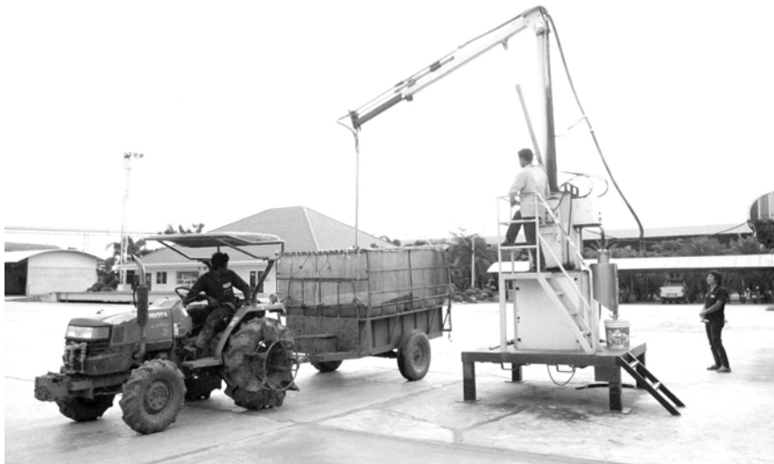
ตลาดกลางข้าวเปลือกที่รับซื้อข้าว

สหกรณ์การเกษตรและกลุ่มเกษตรกรเป็นกลุ่มของผู้ประกอบการกลางนำ สหกรณ์การเกษตรรับซื้อข้าวเปลือกจากสมาชิกแล้วส่งไปจำหน่ายที่ตลาดกลางและโรงสีข้าวซึ่งแต่เดิมในอดีตระบบสหกรณ์ของไทยยังอยู่ในระหว่างการพัฒนาความเข้มแข็ง ทำให้