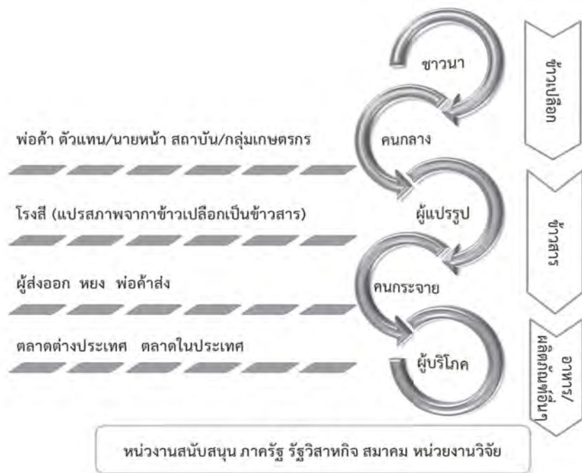
ความเชื่อมโยงของโซ่อุปทานสินค้าข้าว

จากภาพ แสดงให้เห็นถึงผู้เกี่ยวข้อง อยู่มากมายในช่องทางการกระจายของสินค้า ข้าวไทย ซึ่งเริ่มตั้งแต่ต้นน้ำ คือ ขาวนา จนกระทั่งปลายน้ำ คือ ผู้บริโภค มีการแปรรูป จากข้าวเปลือก ข้าวสาร อาหาร และรวมถึงผลิตภัณฑ์อื่นๆ ที่ตอบสนองความต้องการ ผู้บริโภคที่หลากหลายและสามารถเพิ่มมูลค่า ของสินค้า นอกจากนี้ในห่วงโซ่อุปทานของข้าว ไทยนั้นยังมีหน่วยงานที่สนับสนุนผู้เกี่ยวข้องทุก ฝ่ายโดยตลอดตั้งแต่ต้นน้ำจนถึงปลายน้ำ ซึ่ง หน่วยงานที่เกี่ยวข้องนี้ ได้แก่ หน่วยงานภาค รัฐ รัฐวิสาหกิจ รวมถึงสมาคมและหน่วยวิจัย ต่างๆ เช่น สำนักงานเศรษฐกิจการเกษตร กระทรวงเกษตรและสหกรณ์ กรมส่งเสริม การเกษตร กรมการค้าภายใน กรมการค้า ต่างประเทศ และองค์การคลังสินค้า (อคส.) กระทรวงพาณิชย์ ธนาคารเพื่อการเกษตร