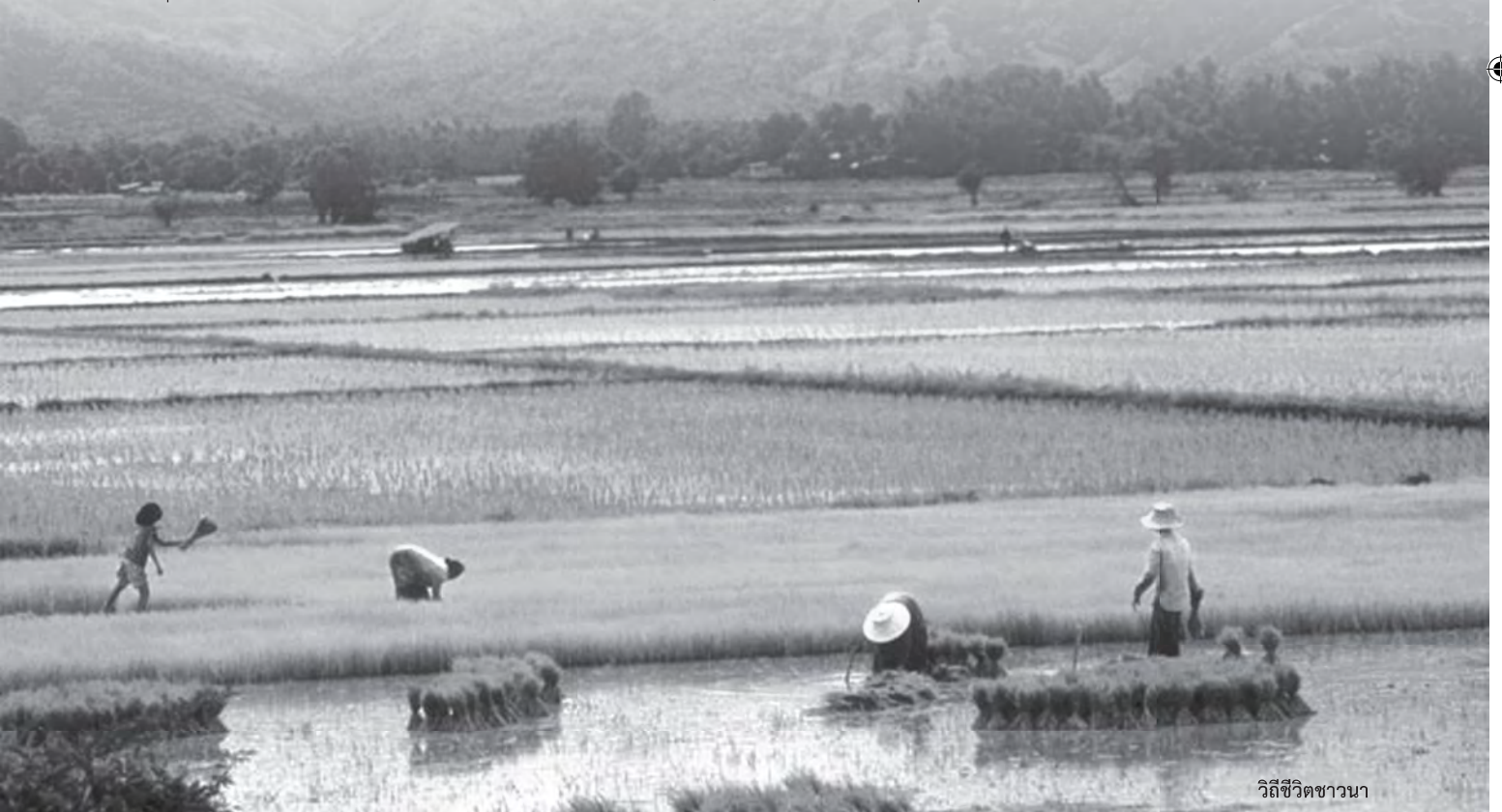
วิถีชีวิตชาวนา

และกำไร อันเป็นกิจกรรมที่จะต้องเชื่อมโยงกับกลไกตลาดในระดับต่างๆ รวมถึงกลไกการจัดการความรู้และความสามารถในไร่นาของชาวนาเอง ชาวนาในวันนี้แม้จะต้องเดินหน้าต่อไป แต่จะมีกระบวนการอย่างไรที่จะสร้างความสัมพันธ์เชื่อมโยงบนเส้นทางอุปทาน 1 ของสินค้าข้าวที่ผลิตได้ให้เกิดขึ้นอย่างมั่นคงและเป็นธรรม