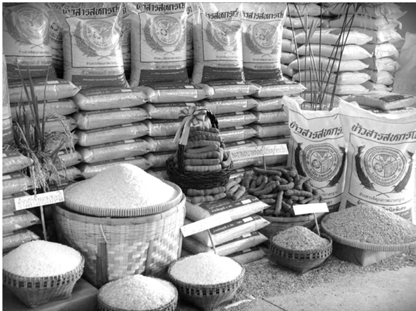
สหกรณ์การเกษตร

ธุรกรรมที่เกี่ยวกับการค้าข้าวเปลือกที่เรียกว่า ธุรกิจขาย ยังไม่มีประสิทธิภาพในการดำเนินงาน สหกรณ์ส่วนใหญ่เป็นผู้ดำเนินงานด้านการให้สินเชื่อแก่ชาวนาและรวมถึงการจัด