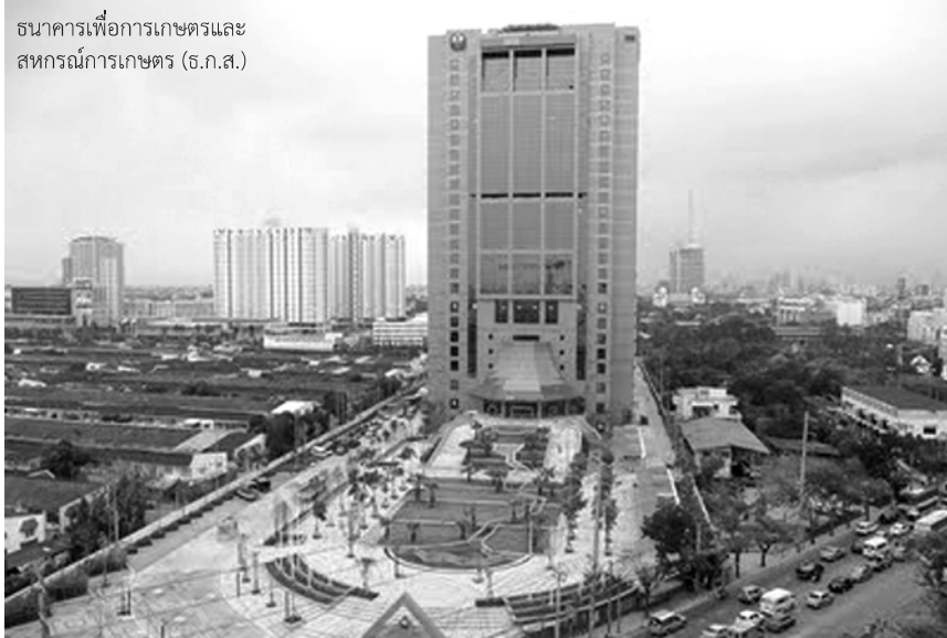
ธนาคารเพื่อการเกษตรและ สหกรณ์การเกษตร (ธ.ก.ส.)

จะทำหน้าที่ในการให้บริการสีข้าวเพื่อแลก กับรายได้จากปลายข้าว รำ และแกลบ