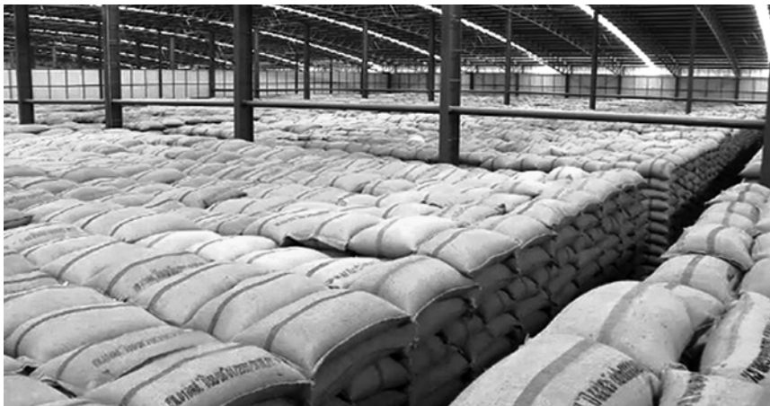
ไซโลเก็บข้าว