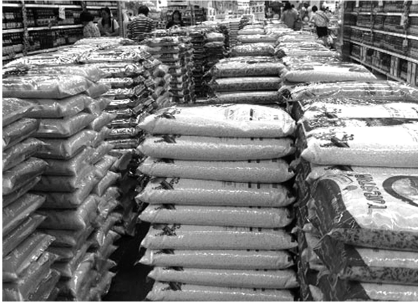
ผู้บริโภครข้าว

ทรัพย์สินของรัฐ ซึ่งประมาณว่ามีข้าวสารของ รัฐที่เก็บอยู่ในฉางข้าวและไซโลแหล่งต่างๆ ไม่น้อยกว่า 10 ล้านตันข้าวสาร นอกจากไซโลของเอกชนแล้ว หน่วยงานของรัฐ เช่น กรมส่งเสริมการเกษตร กรมส่งเสริมสหกรณ์ องค์การ ตลาดเพื่อเกษตรกร และองค์การคลังสินค้า ก็มีฉางข้าวและไซโลภายใต้การดูแลจำนวนหนึ่งแต่ส่วนมากเป็นไซโลขนาดเล็ก มีขนาด จัดเก็บในแต่ละแห่งได้ไม่เกิน 500 ตัน 14