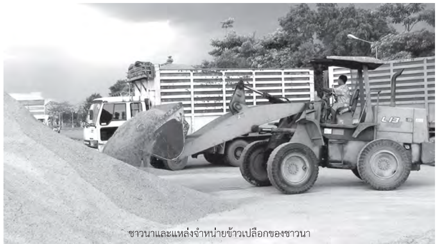
ชาวนาและแหล่งจำหน่ายข้าวเปลือกของชาวนา