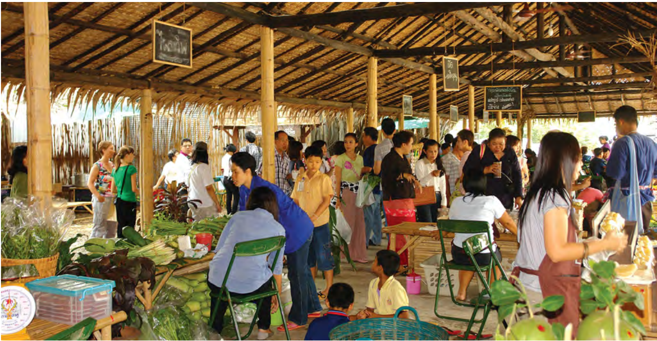
ตัวอย่างธุรกิจฐานสังคม