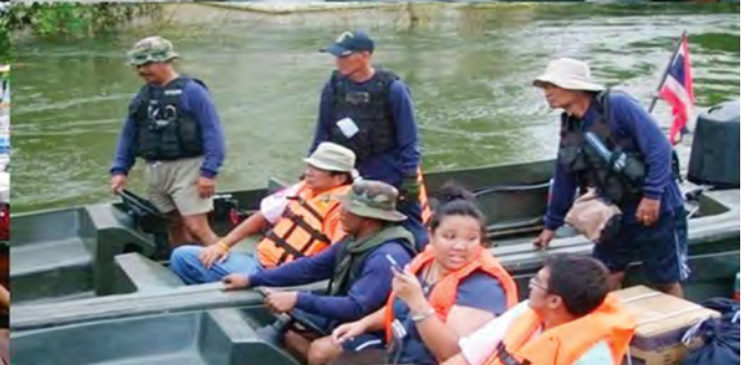
กลุ่มองค์กรที่ไม่แสวงผลกำไร (Non-Profit organization)