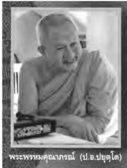
พระพรหมคุณาภรณ์ (ป.อ.ปยุตโต)

1) พวกตื่นเต้นข่าวสาร คือ มีข่าวอะไรจะให้ความสนใจทุกเรื่อง แต่เอาแค่พอรู้เป็นเลาๆ เช่น ฟังเขาเล่า ดูโทรทัศน์ หนังสือพิมพ์ ฯลฯ แบบผ่านๆ ตา ผ่านๆ หู ขอบเอาเรื่องที่รู้เลาๆ นั้นมาเล่าลือ วิพากษ์วิจารณ์ให้ดูตื่นเต้นจะได้ทันสมัย ไม่ตกข่าว