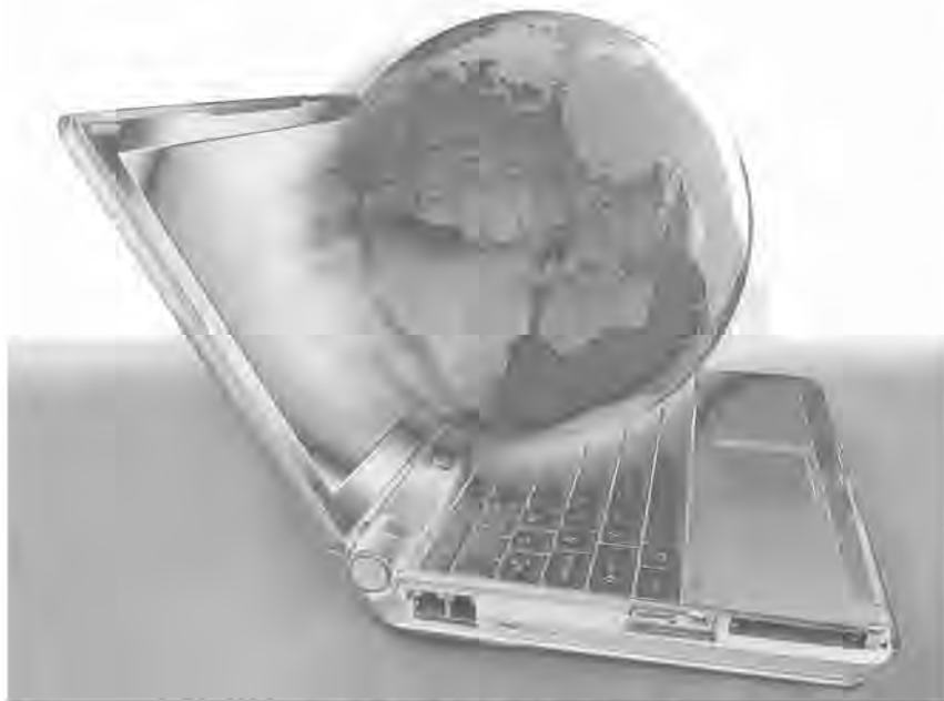
คอมพิวเตอร์เป็นเครื่องมือสำคัญในการย่อโลกช่วยให้การรับส่งข้อมูลเป็นไปอย่างรวดเร็วในปัจจุบัน

การเผยแพร่ข้อมูลข่าวสารยังทำได้สะดวกมากเท่าไร ก็ยังทำให้ใครต่อใครสามารถส่งข้อมูลข่าวสารของตนเองออกไปให้แก่ผู้อื่นรับทราบได้ง่ายมากขึ้นเท่านั้น โดยที่ตรวจสอบได้ยากมากกว่า จริงหรือเท็จ ประสงค์ดีหรือประสงค์ร้าย มุ่งหลอกลวงเอาเงินหรือเอาประโยชน์ด้านอื่นๆ เพราะมันมีปริมาณมากจนกระทั่งจะหวังพึ่งพาหน่วยงานใดให้ตรวจสอบนั้นทำได้ยากหรือแทบจะเป็นไปไม่ได้ เช่น เนื้อหาของรายการต่างๆ ในโทรทัศน์ดาวเทียมและเคเบิลทีวีที่มีกว่า 200 ช่อง แต่ละช่องมีการโฆษณาขายสินค้าจำนวนมากมาย ที่อันตรายและเป็นปัญหาใหญ่ในปัจจุบันคือ การขายยาสารพัดชนิด ทั้งยารักษาโรค ยาลดความอ้วน ยาทาผิวให้ขาว หน้าไม่เหี่ยววัน ฯลฯ โฆษณาที่แอบแฝงการขายบริการทางเพศ รวมไปถึงยารักษาแมลง บัญ ในกาเกษตร โดยยังไม่มีหน่วยงานใดที่จะตามดูได้ว่า สินค้าทั้งหลายมีสรรพคุณตามโฆษณาจริงหรือไม่ คนดูหากเชื่อตามโดยง่ายก็อาจจะถูกหลอกให้เสียเงินทองไปเปล่าๆ โดยไม่ได้ของมา หรือที่แยกว่า