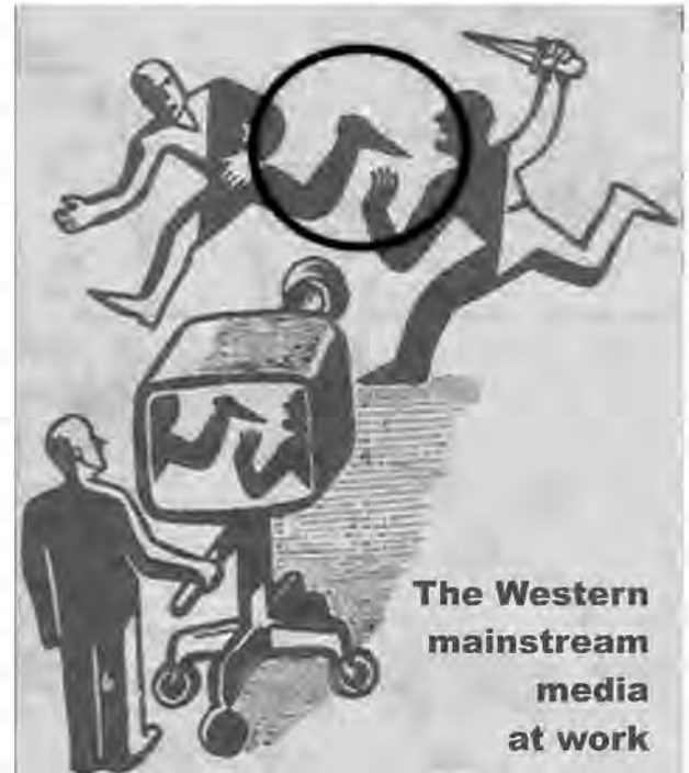
สิ่งที่เห็นทางสื่อ อาจไม่ใช่ความจริงทั้งหมดตามที่เห็นก็เป็นได้ ต้องรู้เท่าทันสิ่งเหล่านี้

ชีวิตของเราทุกวันนี้อยู่ที่ท่ามกลางเงาสะท้อนจำนวนมากมายมหาศาล วันหนึ่งๆ เราได้รับข่าวสารมากมายหลายด้าน หากเราไม่เข้าใจและไม่รู้เท่าทันความจริงในข้อนี้ เราก็อาจจะเกิดการได้สองอย่าง อย่างหนึ่งคือเป็นคนเชื่ออะไรง่ายและเร็วเกินไป อีกอย่างหนึ่งคือสับสนไม่รู้จะเชื่อใครดี แต่ความยากของการจะไม่เพเลอไหลเข้าใจผิดไปกับเงาสะท้อนในสังคมปัจจุบันก็คือจะเป็นเรื่องยากไม่น้อย เพราะเงาสะท้อนมีความสมจริงหรือ “เสมือนจริง” มาก จนเราอาจเพเลอเป็นแบบชายโง่ในนิทานพื้นบ้านไปได้ง่าย ถึงแม้ข่าวที่ดูเหมือนว่ามีได้มีเป้าหมายชวนเชื่อเหมือนโฆษณา แต่ถ้าเราไม่เข้าใจขั้นตอนและกระบวนการผลิตข่าวสาร เราก็อาจเข้าใจไปได้ว่าข่าวและความจริงเป็นสิ่งเดียวกัน ซึ่งเป็นความเข้าใจที่ผิดอย่างสิ้นเชิง เพราะข่าวที่ปรากฏออกมามทางสื่อ