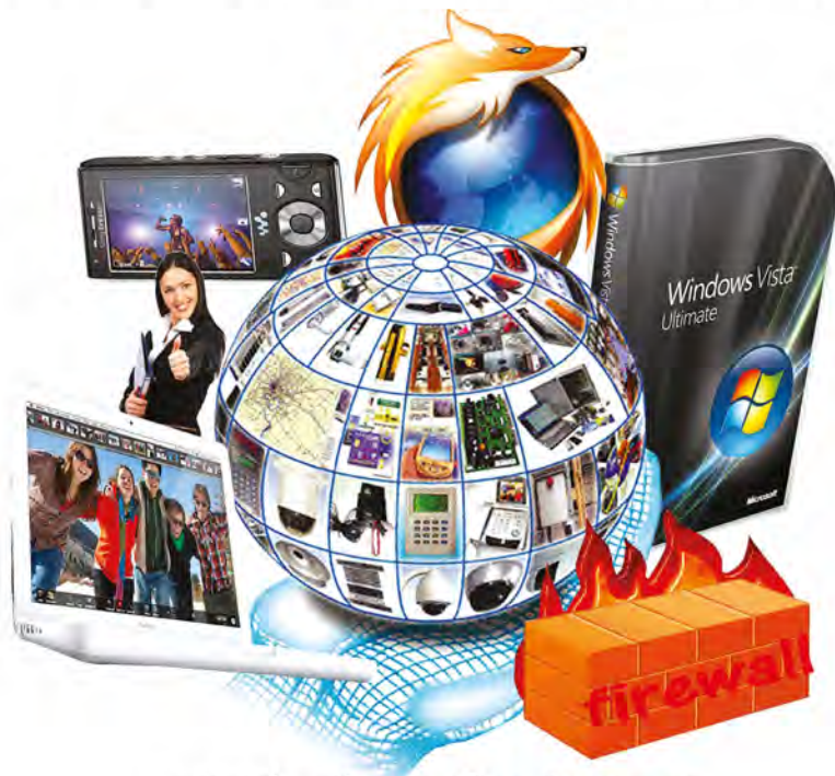
การติดต่อสื่อสารที่หลากหลายใน “ยุคข้อมูลข่าวสาร”

เขตเมือง เนื่องจากระบบโทรคมนาคมและถนนหนทางมีน้อย ไม่เชื่อมต่อกัน แต่ปัจจุบันเปลี่ยนแปลงไปอย่างสิ้นเชิง เราสามารถติดต่อสื่อสาร ส่งข้อมูลข่าวสาร