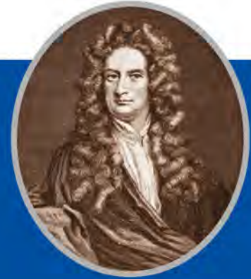
เซอร์ไอแซค นิวตัน นักวิทยาศาสตร์ชาวอังกฤษ

เซอร์ไอแซค นิวตัน นักวิทยาศาสตร์ชาวอังกฤษที่คนทั่วโลกเชื่อกันว่าเป็นคนเก่งสุดยอดในโลกวิทยาศาสตร์ เคยกล่าวไว้ว่า “โลกใบนี้ก็เหมือนหนังสือเล่มใหญ่เล่มหนึ่ง คนที่ไม่ออกจากบ้านไปไหน คือคนที่ได้อ่านหนังสือเพียงหน้าเดียว” คำพูดประโยคนี้ของเขาช่วยเตือนใจพวกเราว่า โลกของเรานี้มีเรื่องต้องเรียนรู้มากมาย ไม่ว่าจะเป็น ความรู้เรื่องของธรรมชาติ การประกอบอาชีพ การดูแลรักษาสุขภาพร่างกาย-จิตใจ วัฒนธรรมประเพณี ความบันเทิง และอื่นๆ อีกมากมาย ความรู้จึงเป็นสิ่งสำคัญสำหรับการอยู่รอด ปู่ย่าตายายของเรา ท่านก็อยู่รอดมา นับพันๆ ปีได้ก็เพราะอาศัย “ภูมิปัญญา” หรือความรู้ประจำถิ่น ประจำชุมชน ซึ่งท่านทั้งหลายเรียนรู้จากสภาพแวดล้อมและธรรมชาติรอบตัว พร้อมเรียนรู้จากการแลกเปลี่ยนกับผู้ที่อยู่อาศัยร่วมกันในครอบครัวหรือชุมชนอย่างต่อเนื่องตลอดเวลา