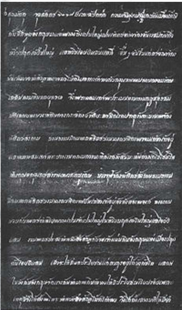
สนธิสัญญาเบาว์ริง

การผลิตเชิงการค้าและการขยายการผลิตในระดับไร่นาจของครัวเรือนภายหลังการทำสนธิสัญญาเบาว์ริง (Bowring Treaty) [กับอังกฤษ ได้กระตุ้นให้ครัวเรือนชาวนาเกิดความต้องการเงินทุนเพิ่มเติม ทั้งเพื่อการปรับปรุงที่ดิน การจัดหาปัจจัยการผลิต ตลอดจนเครื่องมือและอุปกรณ์การเกษตร เพราะเป็นโอกาสที่ชาวนาจะเพิ่มพูนรายได้ให้กับครัวเรือนจากการขยายการผลิตเพื่อการค้า อันเป็นผลจากความต้องการข้าวที่มีมากขึ้นจากการขยายตัวของตลาดส่งออกในขณะนั้น ในอดีตเมื่อถึงฤดูเพาะปลูก ชาวบ้านที่ต้องการเงินทุนจึงต้องพึ่งพาเงินกู้จาก นายทุนผู้มีฐานะในหมู่บ้านหรือพ่อค้าผลิตผล ซึ่งเป็นเงินกู้จากแหล่งเอกชนหรือเรียกกันทั่วไปว่า “เงินกู้นอกระบบ” ทั้งนี้ เพราะบุคคลเหล่านี้มีเงินสดอยู่ในมือ ขณะที่ชาวนาไม่มีเงินสดในมือ อีกทั้ง ในยามเดือดร้อน หรือเจ็บป่วย ก็ต้องอาศัยพึ่งพาผู้ให้กู้นอกระบบและญาติพี่น้อง เพราะเป็นกลุ่มบุคคลในชนบทเพียงกลุ่มเดียวที่มีความใกล้ชิดพอพึ่งพากันได้ เพราะมีความจำเป็นเร่งด่วน