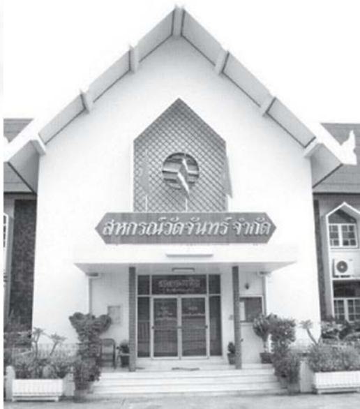
สหกรณ์หาทุนวัดจันทรไม่จำกัดสินใช้ : สหกรณ์แห่งแรกของประเทศไทย

การจัดตั้งสหกรณ์หาทุนในยุคนั้น ถือได้ว่าเป็นจุดเริ่มต้นของแหล่งให้กู้ยืมสถาบัน 6 และเป็นการให้กู้ยืมเพื่อกิจกรรมการเกษตรแก่สมาชิกสหกรณ์ได้กู้ยืมเงินไปเป็นทุนรอนในการประกอบ