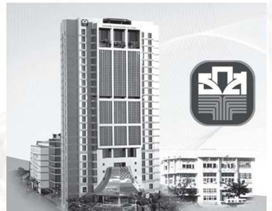
ธนาคารเพื่อการเกษตรและสหกรณ์การเกษตร