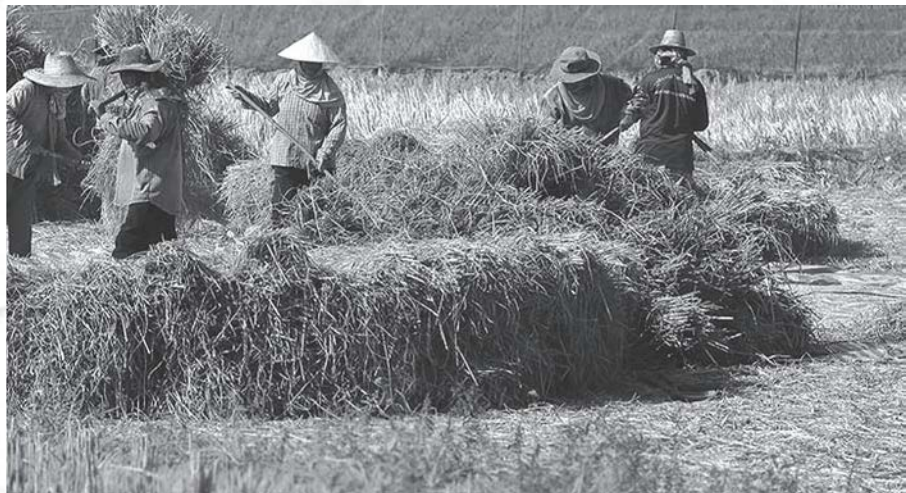
ความลำบากยากจนของชาวนาไทยในอดีต

การผลิตเชิงการค้าและการขยายการผลิตในระดับไร่นาจของครัวเรือนภายหลังการทำสนธิสัญญาเบาว์ริง (Bowring Treaty) [กับอังกฤษ ได้กระตุ้นให้ครัวเรือนชาวนาเกิดความต้องการเงินทุนเพิ่มเติม ทั้งเพื่อการปรับปรุงที่ดิน การจัดหาปัจจัยการผลิต ตลอดจนเครื่องมือและอุปกรณ์การเกษตร เพราะเป็นโอกาสที่ชาวนาจะเพิ่มพูนรายได้ให้กับครัวเรือนจากการขยายการผลิตเพื่อการค้า อันเป็นผลจากความต้องการข้าวที่มีมากขึ้นจากการขยายตัวของตลาดส่งออกในขณะนั้น ในอดีตเมื่อถึงฤดูเพาะปลูก ชาวบ้านที่ต้องการเงินทุนจึงต้องพึ่งพาเงินกู้จาก นายทุนผู้มีฐานะในหมู่บ้านหรือพ่อค้าผลิตผล ซึ่งเป็นเงินกู้จากแหล่งเอกชนหรือเรียกกันทั่วไปว่า “เงินกู้นอกระบบ” ทั้งนี้ เพราะบุคคลเหล่านี้มีเงินสดอยู่ในมือ ขณะที่ชาวนาไม่มีเงินสดในมือ อีกทั้ง ในยามเดือดร้อน หรือเจ็บป่วย ก็ต้องอาศัยพึ่งพาผู้ให้กู้นอกระบบและญาติพี่น้อง เพราะเป็นกลุ่มบุคคลในชนบทเพียงกลุ่มเดียวที่มีความใกล้ชิดพอพึ่งพากันได้ เพราะมีความจำเป็นเร่งด่วน