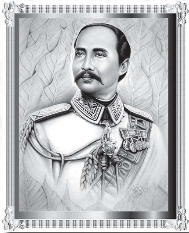
พระบาทสมเด็จพระจุลจอมเกล้าเจ้าอยู่หัว รัชกาลที่ 5