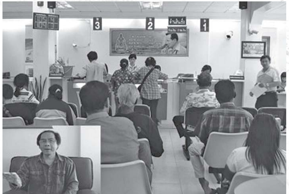
การให้บริการกู้ยืมเงินแก่เกษตรกร

หลักทรัพย์อย่างอื่นเป็นหลักประกัน อย่างไรก็ตามแนวทางในการจัดตั้งธนาคารให้กู้ยืมแห่งชาตินั้น แม้จะไม่ได้มีการจัดตั้งขึ้นในขณะนั้น แต่ในระยะต่อมาได้มีการจัดตั้งธนาคารเพื่อการเกษตรและสหกรณ์การเกษตร (ธ.ก.ส.) ในปี 2509 ทั้งนี้เพื่อให้เป็นแหล่งสินเชื่อและให้กู้ยืมเงินแก่พี่น้องชาวนาที่ขาดแคลนเงินทุนในการทำเกษตร เมื่อมีการจัดตั้งธนาคาร ธ.ก.ส. ขึ้นแล้วได้มีการรวบรวมธนาคารเพื่อการสหกรณ์เข้ากับการดำเนินงาน