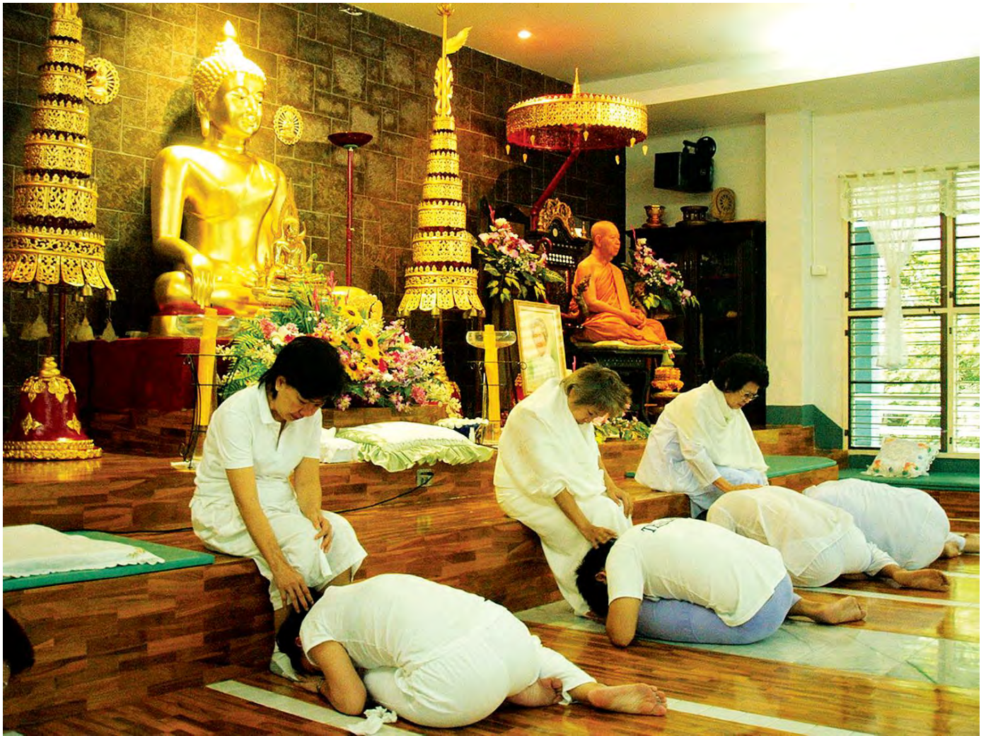
ความกตัญญูกตเวทิต่อพ่อแม่