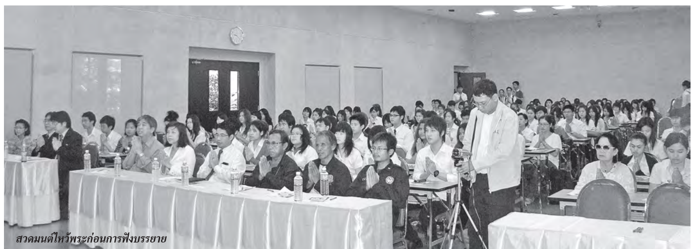
สวดมนต์ไหว้พระก่อนการฟังบรรยาย

สำหรับ “โครงการซื้อข้าวจากชาวนา” เกิดขึ้นเนื่องจากมีกลุ่มหนึ่งเห็นว่าสังคมไทยในปัจจุบันมีการแข่งขันสูงขึ้นมา ทำให้ประชาชนต้องเผชิญกับปัญหาต่างๆ หลายด้าน โดยเฉพาะปัญหาด้านเศรษฐกิจที่นับวันจะรุนแรงมากขึ้น จากการค้าต่างชาติดีมีโอกาสเข้ามาลงทุนทำธุรกิจในบ้านเราเพื่อหวังผลกำไรเพียงอย่างเดียว จึงส่งผลกระทบต่อทั้งทางตรงและทางอ้อมแก่ชาวนาผู้เปรียบเสมือนกระดูกสันหลังของชาติ (ที่ฉันได้ยินการเปรียบเทียบแบบนี้มาตั้งแต่เด็กๆ) และส่งผลต่อการผลิต “ข้าว” ซึ่งเป็นผลผลิตทางการเกษตรที่สำคัญของไทย โดยชาวนาผู้ผลิตข้าวเป็นกลุ่มอาชีพที่ต้องต่อสู้ดิ้นรนเพื่อความอยู่รอดพร้อมกับต้องเผชิญปัญหาภัยธรรมชาติมากมายทั้งน้ำท่วมทั้งฝนแล้งแลมโดนพ่อค้าคนกลางกดราคาอีก เหล่านี้จึงเป็นที่มาของโครงการซื้อข้าวจากชาวนา ที่ริเริ่มขึ้นในปี 2555 ภายใต้แนวคิด “การรวมซื้อ” ด้วยการบริหารจัดการของร้าน Farmer Shop เพื่อกระจายสินค้าให้แก่