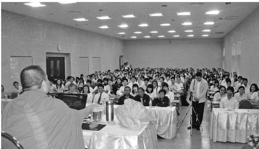
บรรยายภาคภายในห้องบรรยาย

“แผ่นดินธรรมนำใจให้ไร้ทุกข์ แผ่นดินทองพาทายสุขไม่ทุกข์เข็น แผ่นดินเพชรมีความเด่นที่र्मเย็น เพราะว่าเป็นแผ่นดินไทยไม่ไร้ธรรม เมื่อไม่ได้พัฒนาที่จิตใจ จะพัฒนาด้านใดใดก็ไร้ผล การพัฒนาจึงต้องเริ่มที่ใจคน เพื่อเกิดผลพัฒนาที่ถาวร”