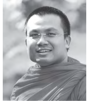
พระมหาสมปอง ดาลปุตุโต

วันพุธที่ 15 กุมภาพันธ์ 2555 เป็นวันดีอีกวันหนึ่งในชีวิตที่ฉันได้มีโอกาสเข้าร่วมฟังการบรรยายธรรมจาก พระมหาสมปอง ดาลปุตุโต ซึ่งคณะเศรษฐศาสตร์ มหาวิทยาลัยเกษตรศาสตร์ ได้จัดขึ้นในหัวข้อ “เปิดใจใส่ธรรมะ ร่วมแบ่งปัน สร้างสรรค์สังคม” บรรยายากในวันนั้นเป็นไปอย่างอบอุ่นจากการต้อนรับของพี่ๆ เจ้าหน้าที่สถาบันวิชาการด้านสหกรณ์ ซึ่งเป็นหน่วยงานที่ริเริ่มจัดการบรรยายธรรมในครั้งนี้นับขึ้นมา และได้ยินว่าจัดตามข้อเสนอของพี่น้องศิษย์ในคณะเศรษฐศาสตร์เองที่ต้องการฟังการบรรยายธรรม จากพระมหาสมปอง ดาลปุตุโต ด้วยความประทับใจที่ได้รับในวันนั้นจึงขอเล่าเรื่องราวในช่วงเวลาสั้น ๆ ในวันนั้นมาเล่าสู่กันฟัง