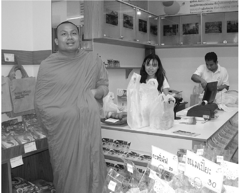
พระมหาสมปอง ดาลปุโต เยี่ยมชมร้าน Farmer Shop

การศึกษาขั้นต้นเมื่อก่อนจะสอนให้คนรู้จักคิด เช่นเดียวกับโครงการวันนี้ เราคิดจะแบ่งปันให้กับสังคมได้อย่างไร ถ้าทำได้สำเร็จชาวนาไทยผู้ผลิตข้าวเป็นอันดับหนึ่งของโลกน่าจะรวยและมีความเป็นอยู่ที่ดีขึ้น นอกจากนี้เมื่อ