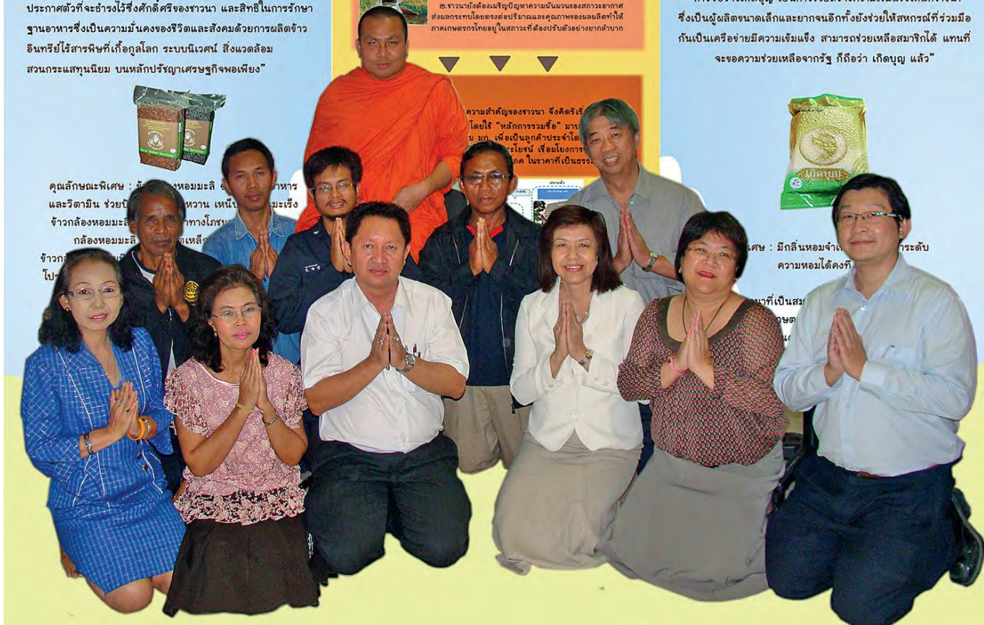
ถ่ายภาพร่วมกับพระมหาสมปอง ตาลปุตฺโต