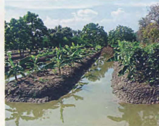
สวนผลไม้ของคุณประเวศ พันธุ์ศรี (ภาพบน) และคุณประภคิต เกิดมณี (ภาพล่าง) ที่มีการปรับเปลี่ยนภายหลังเข้าร่วมอบรมภายใต้ศูนย์เรียนรู้