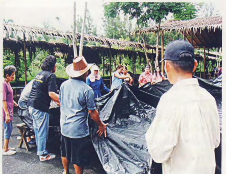
ยามฝนตก หลังคารั่ว ทุกคนมาร่วมมือกันด้วยจิตสำนึก “ความเป็นเจ้าของ”