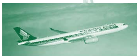
การให้บริการของสายการบินสิงคโปร์แอร์ไลน์

ทะยานขึ้นครั้งใหม่เมื่ออินเดียและจีนได้พัฒนาเศรษฐกิจและเปิดการค้าสู่ต่างประเทศมากขึ้นในราวไม่เกิน 2 ทศวรรษที่ผ่านมานั้นทำให้เปรียบเทียบได้กับแสงที่ส่องประกายวาววับที่ส่องแสงไปให้ผู้คนทั่วโลกได้เห็น และบ่งบอกให้โลกรู้ว่านับจากนี้ไปคือเวลาการเติบโตของเอเชีย