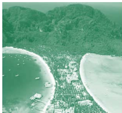
เกาะพีพี จ.กระบี่

ที่กล่าวมาเราต่างอาจจะมีคำถาม ในใจว่า วันนี้เราเคลื่อนภารกิจเหล่านี้ กันจริงจังกแค่ไหน เด็กไทยโดยเฉลี่ย พูดอังกฤษระดับใด เรื่องทรัพย์สินทาง ปัญญาเราเทียบกับประเทศเพื่อนบ้าน แล้วพอจะบ่งชี้อนาคตอะไรบ้างแล้ว จะสรรค์สร้างสิ่งใดเพื่อให้เรื่องเหล่านี้ พัฒนาขึ้น ส่วนเรื่องการจัดการน้ำเพื่อ