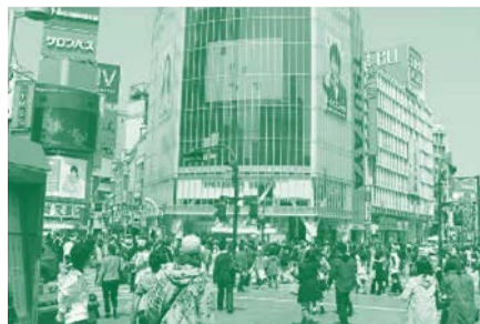
เศรษฐกิจญี่ปุ่นในอดีต

บริหารจัดการสูง การบริหารจัดการที่มีความโปร่งใสติดระดับชั้นนำโลก นี้ยังไม่รวมถึงการจัดอันดับของภาคการให้บริการที่ติดอันดับโลกอีกมากมายเช่น สิงคโปร์ แอร์ไลน์ สนามบินอินชอนที่เกาหลีใต้ หรือ สนามบินชางจี สิงคโปร์ สายการบินฮิวาแอร์ของใต้หวัน และโกเรียลแอร์ไลน์ของเกาหลีใต้ แต่ทว่า การที่เศรษฐกิจเอเชียได้