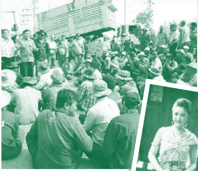
ชาวนารวมตัวประท้วง เนื่องจากราคาข้าวตกต่ำ