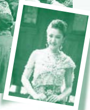
สยามเมืองยิ้ม

เศรษฐกิจเอเชีย สิ่งที่เราพอจะคาดเดา แนวโน้มของความสามารถในการแข่งขัน ของประเทศใดประเทศหนึ่งจะเกี่ยวข้องกับ 8 ปัจจัยดังนี้คือ (1) อัตราการ เพิ่มขึ้นของการใช้ทรัพยากรธรรมชาติ ที่สูงมากจะส่งผลให้การจัดการด้าน พลังงานเป็นประเด็นที่หลายชาติจัด ให้เป็นวาระแห่งชาติ (2) คนรุ่นใหม่ที่มี สามารถสื่อสารภาษากับคู่ค้าได้จะมี ความได้เปรียบในการแข่งขัน (3) พลัง แห่งการใช้เทคโนโลยีสารสนเทศเพื่อ ให้เกิดประโยชน์สูงสุดจะนำไปสู่การ เพิ่มประสิทธิภาพของธุรกิจ (4) พลัง แห่งความร่วมมือของเครือข่ายระหว่าง ประเทศจะเสริมสร้างความเข้มแข็งให้ กับกลุ่มอุตสาหกรรม (5) ความสามารถ ในการปรับตัวของชนในชาติในการเป็น สังคมฐานความรู้ ที่ชนในชาติแสวงหา ความรู้มาใช้ประโยชน์ได้ จะเป็นตัวแปร ที่สำคัญต่อการพัฒนาประเทศ (6) การ ขับเคลื่อนภารกิจอย่างจริงจังกับระบบ น้ำชลประทานของประเทศหรือกลุ่ม ประเทศจะนำมาซึ่งการได้ประโยชน์ ร่วมกัน (7) ความสามารถในการสร้าง ชนในชาติเพื่อการขับเคลื่อนในการ บริหารประเทศได้จริงจะนำไปสู่ระบบ คุณค่าและมูลค่า และ (8) คือการเป็น เจ้าของนวัตกรรม สิทธิบัตร ลิขสิทธิ์