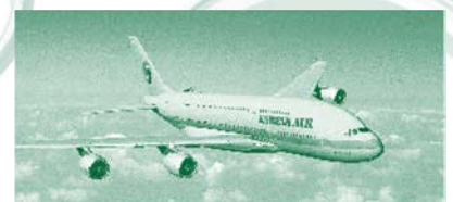
การให้บริการของสายการบินโกเรียลแอร์ไลน์

ประเด็นสำคัญของความแข็งแกร่งเศรษฐกิจเอเชียก็คือ ผลกระทบจากวิกฤตการเงินโลกในปี 2551 นั้น ประเทศในกลุ่มเอเชียได้รับผลจากวิกฤตดังกล่าวน้อยกว่าเมื่อเทียบกับอเมริกา และยุโรป แม้สิ่งที่ยืนยันในประเทศเราเองก็ได้แก่ ประเทศไทยได้พึ่งพาสหรัฐเพื่อการส่งออกในเอเชียด้วยกันมากขึ้น (ปัจจุบันร้อยละ 60 ของการส่งออกจากไทยอยู่ในตลาดเอเชีย) ทำให้นับจากนี้เป็นต้นไปการเปลี่ยนแปลงที่ทำให้เกิดพลังทางเศรษฐกิจในเอเชียจะนำไปสู่วิวัฒนาการใหม่ในด้านเศรษฐกิจการค้า การลงทุน และสังคมศาสตร์ รวมถึงการไหลบ่าของวัฒนธรรมอันที่มีการสื่อสารที่รวดเร็วจากกระแสโลกาภิวัตน์ จะมีความเปลี่ยนแปลงต่อไปโดยเกิดจากพลังของความรู้ อีกมาก เช่นปัจจุบัน ผู้นำเรื่องการผลิตผลกระทบจากภาวะโลกร้อนต้องยกให้กลุ่มสหภาพยุโรป ผู้นำด้านนวัตกรรมต้องยกให้อเมริกา ยุโรป ญี่ปุ่น และเกาหลีใต้ ผู้นำด้านการผลิตต้องยกให้จีน และอินเดีย ขณะ