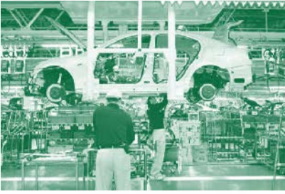
อุตสาหกรรมยานยนต์

ที่ผู้นำการผลิตข้าวของโลกต้องเอเชีย ตะวันออกเฉียงใต้