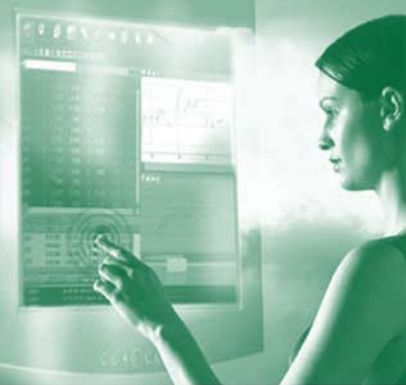
ผู้นำแห่งเทคโนโลยี

ประเทศไทยถูกจัดว่าเป็นประเทศที่ ประเทศต่างๆ ในอาเซียนหวังพึ่งพาในฐานะผู้นำอาเซียนเมื่อหลายปีก่อน กลับกลายเป็นประเทศอื่นๆ ต้องหา รือมาช่วยคลี่คลายปัญหาให้กับไทย เมื่อครั้งเกิดเหตุการณ์ความไม่สงบใน ประเทศไทยอยู่หลายครั้งหลายคราในช่วง 5 ปีที่ผ่านมา