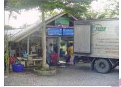
จุดรวบรวมผลผลิตของเครือข่าย

จัดบันทึกการผลิต จะทำให้เห็นปัญหาชัดเจนขึ้น สามารถวางแผนและประเมินการผลิตจากข้อมูลที่ได้ ซึ่งนำไปสู่การพัฒนาการผลิตร่วมกัน”