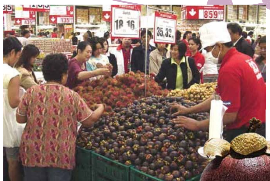
ส่งผลไม้ไปจำหน่ายในห้างสรรพสินค้า

วิถีตลาดของจังหวัดจันทบุรี มีตลาดใหญ่ ๆ 3 ตลาด คือ ตลาดปากแซง ตลาดเนินสูง และตลาดหนองคล้า ตลาดส่วนใหญ่มีพฤติกรรมการซื้อผลไม้ริมทาง ไม่มีจุดรับซื้อที่เป็นมาตรฐาน เมื่อผลผลิตออกมาเป็นจำนวนมาก แต่ไม่มีตลาดรองรับ ผลผลิตจึงถูกบรรทุกเร่งหาพ่อค้าไปเรื่อย ๆ เป็นการสิ้นเปลืองค่าใช้จ่าย เพิ่มความเสียหายให้กับผลผลิต สุดท้ายราคาที่ได้รับคือความจายนม