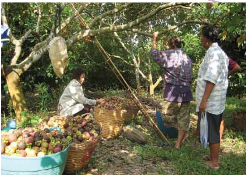
การเกี่ยวเกี่ยว การบรรจุ และการขนส่ง ที่ทำให้มังคุดไม่ได้คุณภาพ

เกษตรกรจะมีใครทำต่อ ถ้าทายาทไม่เห็นความสำคัญอาชีพของเกษตรกร พบว่าการดำเนินการรวบรวมผลไม้ของสหกรณ์ส่วนมากต้องรอทางราชการสนับสนุนงบประมาณค่าบริหารจัดการ ตลาดขึ้นอยู่กับนโยบายของทางราชการมาตลอด ซึ่งคิดว่าไม่ยั่งยืน