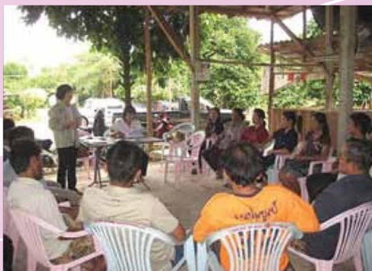
จัดเวทีเพื่อวางแผนการจัดการคุณภาพผลิตร่วมกับสมาชิก

สหกรณ์การเกษตร สมาชิกส่วนใหญ่ทำการเกษตร แต่ต้องประสบปัญหาราคาสินค้าตกต่ำอย่างต่อเนื่อง เกษตรกรประสบกับการขาดทุน มีหนี้สิน ไม่สามารถชำระหนี้ได้ ส่งผลกระทบต่อการค้าเงินธุรกิจของสหกรณ์ สหกรณ์เป็นองค์กรเกษตรของ