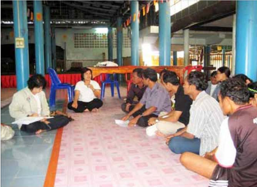
เกิดการเรียนรู้ร่วมกันในการแก้ปัญหา