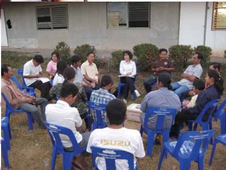
เวทีเรียนรู้เพื่อวางแผนการแก้ปัญหาคุณภาพผลไม้ร่วมกับสมาชิก

มีเวลาจำกัด ทำให้มีผลไม้ออกสู่ตลาดพร้อมกัน และมีปริมาณมาก มีระยะเวลาเก็บเกี่ยวจำกัด ทำให้เกิดการกระจุกตัว ส่งผลกระทบต่อภาวะผลไม้ล้นตลาด ตลาดรองรับไม่เพียงพอ มีผลกระทบทำให้ราคาผลไม้ตกต่ำ เกษตรกรสมาชิกหมดกำลังใจในการทำการเกษตร อาชีพ