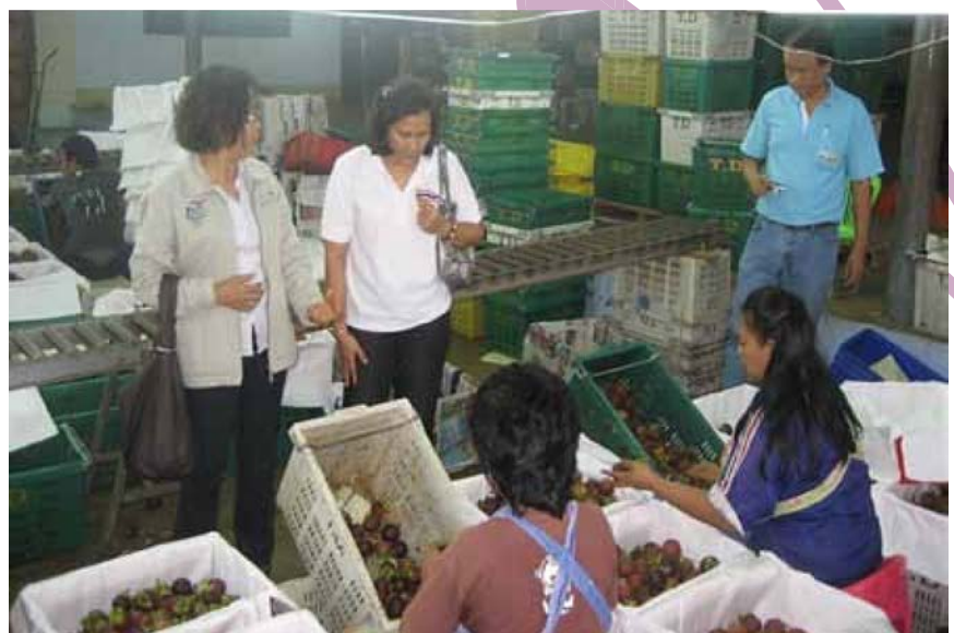
จุดรวบรวมผลผลิตจากสมาชิก

ช่องทางการจำหน่ายได้เพิ่มขึ้น ผลไม้คุณภาพมีไม่พอขาย ตลาดยังมีความต้องการอีกมาก เครือข่ายจึงร่วมมือกันอย่างจริงจัง ภายใต้ระบบการค้าที่เป็นธรรม ในการรวมกันขาย ทำให้ลดต้นทุนค่าขนส่ง สามารถลดค่าใช้จ่าย ทำให้มีรายได้เพิ่ม ยกระดับองค์กรเกษตรกรให้มีศักยภาพทางการตลาด