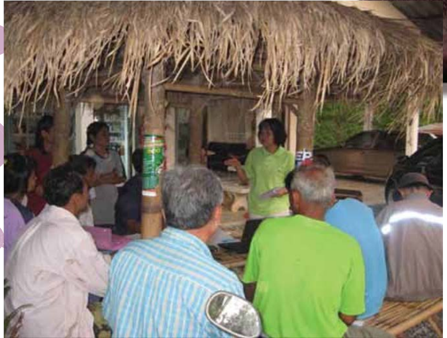
การจัดเวทีการเรียนรู้เพื่อวางแผนการแก้ปัญหาคุณภาพผลผลิตร่วมกับสมาชิก

การส่งเสริม สนับสนุนให้เกษตรกรได้มีความเข้าใจและมองเห็นทิศทางที่ชัดเจนในอนาคต เรื่องราวการวางแผนการผลิตต้องให้สัมฤทธิ์ผล ต้องปรับเปลี่ยนแนวคิด ทักษะ เกษตรกรให้เห็นความสำคัญของการรวมกลุ่มผู้ผลิตมังคุดคุณภาพ มีการวางแผนการเพาะปลูก / ผลิตพืชหลัก พืชรอง และการจัดการอย่างเป็นระบบ มุ่งไปที่การมองตลาดการนำการผลิต มีการจัดการคุณภาพตามความต้องการของตลาด ตลอดสายการผลิต ทั้งเกรดคุณภาพ ตลาดส่งออกต่างประเทศ เช่น จีน ญี่ปุ่น ยุโรป เกรดและราคาก็จะแตกต่างกัน ถ้าตลาดภายในประเทศ ก็ยังมีตลาดบนห้างสรรพสินค้า ซึ่งเกรดและราคาก็ต่างกัน จนถึงตลาดปลายทางต่างจังหวัด ก็เป็นอีกเกรดราคาก็จะต่างไปอีก เมื่อเกษตรกรมองเห็นช่องทางการตลาดที่ชัดเจน เกษตรกรก็จะมีความมั่นใจในการผลิตผลไม้ให้ได้คุณภาพ เพื่อสร้างความพึงพอใจให้กับคู่ค้า จนพัฒนาไปสู่การเป็นคู่ค้าถาวร ส่งผลต่อการเพิ่มช่องทางการตลาดในอนาคต