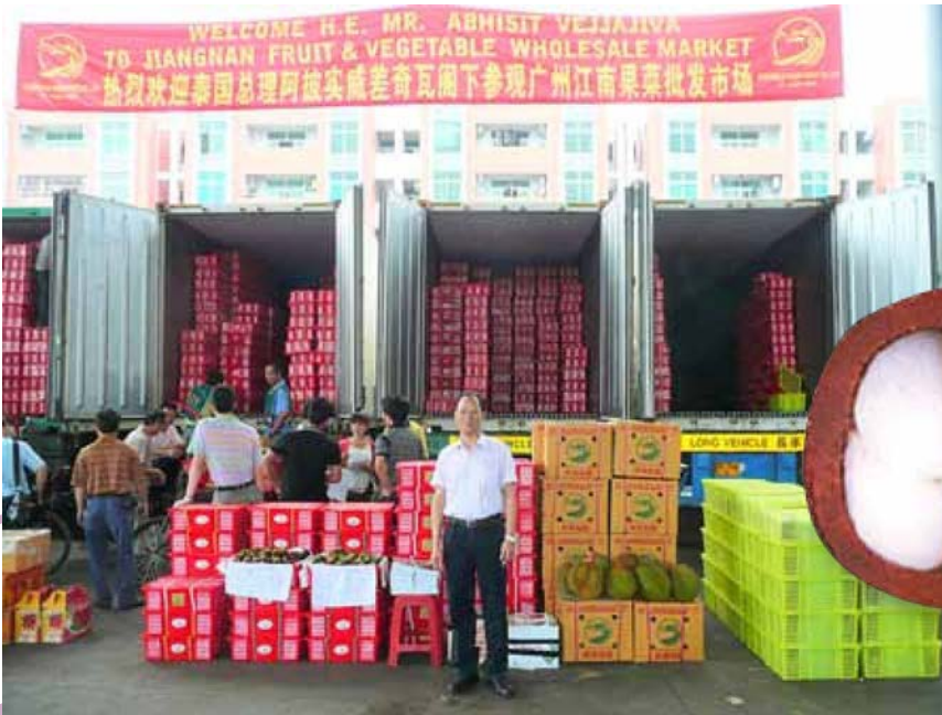
ส่งออกผลไม้ไปยังตลาดต่างประเทศ