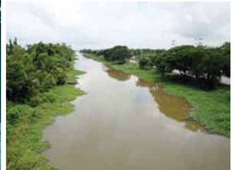
คลองรังสิต

มลายูของมาเลเซีย เป็นต้น ทำให้การค้าข้าวมีความรุ่งเรือง และผลตอบแทนจากการค้าที่มีมากได้เป็นแรงสนับสนุนให้เกิดการขุดคลองต่างๆ เช่น คลองภาษีเจริญ คลองดำเนินสะดวก คลองรังสิต เป็นต้น เพื่อการบุกเบิกพื้นที่ใหม่ให้ประชากรได้อพยพไปตั้งถิ่นฐานเพื่อขยายผลผลิตข้าว และเพื่อการขยายฐานภาษีที่นาในสมัยนั้นซึ่งสามารถรวบรวมภาษีนาสู่ท้องพระคลังได้จำนวนมาก ภาษีดังกล่าวส่วนหนึ่งได้ถูกนำมาใช้ในการพัฒนาระบบชลประทาน ในปี พ.ศ. 2448 ประเทศสยามในขณะนั้นได้ส่งออกข้าวคิดเป็นมูลค่าประมาณ 80 ล้านบาท จากมูลค่ารวมของการส่งสินค้าออกในปีนั้น 100 ล้านบาท ซึ่งเป็นเครื่องสะท้อนว่าข้าวได้กลายเป็นพืชเศรษฐกิจหลักของประเทศในขณะนั้น และยังได้ดำเนินเรื่อยมาจนถึงปัจจุบัน