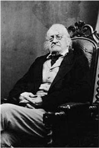
เซอร์ จอห์น เบาริง

สำคัญกับชาติตะวันตกในสมัยนั้น ทั้งนี้ เพราะแต่เดิมนั้นการค้าระหว่างต่าง ชาติ กับสยามจะต้องติดต่อผ่านฝ่าย พระคลังซึ่งเท่ากับว่าฝ่ายพระคลังมี อำนาจในการผูกขาดในการส่งออก