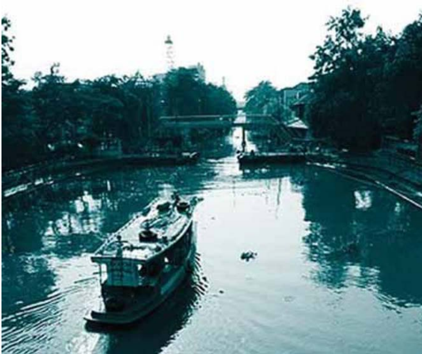
คลองภาษีเจริญ