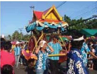
ประเพณีแห่นางแมวขอฝน