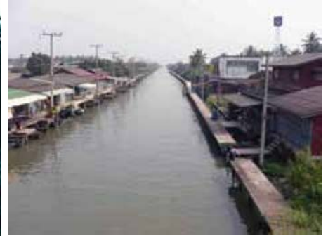
คลองดำเนินสะดวก