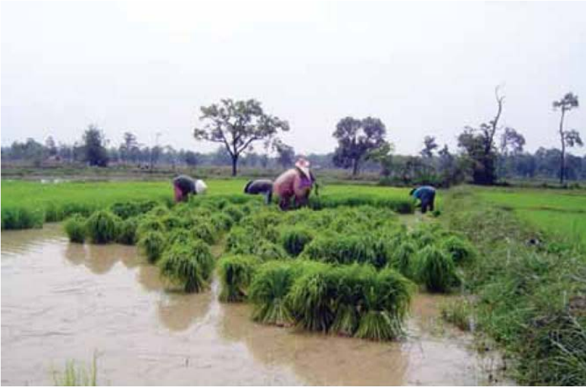
การปลูกข้าวในอดีตของประเทศไทย