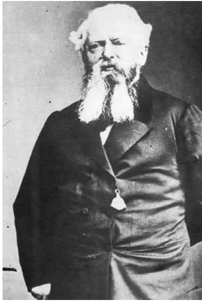
ทาวนเซนต์ แฮร์ริส

กับอีกหลายประเทศ โดยมีสนธิสัญญา เบาริงเป็นต้นแบบ เช่น การทำสนธิ สัญญาแฮร์ริส กับสหรัฐอเมริกาในปี 2398 และการทำสนธิสัญญามงติญี (Montigny) กับประเทศฝรั่งเศสใน