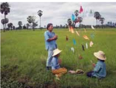
ประเพณีการทำขวัญข้าว

3.7 ล้านครัวเรือนหรือประมาณ 17 ล้านคน ส่วนการใช้ทรัพยากรที่ดินของประเทศนั้นประมาณว่าร้อยละ 59 ของพื้นที่เพาะปลูกพืช ประมาณ 130 ล้านไร่ ได้ใช้ไปในการเพาะปลูกข้าว นอกจากนี้ยังมีกิจกรรมทางธุรกิจอื่นๆ ของอุตสาหกรรมข้าวไทยอีกเป็นจำนวนมาก เช่น โรงสีข้าว ผู้ประกอบการค้าข้าว ผู้ประกอบการรถเกี่ยวข้าว และโรงงานแปรรูปข้าว เป็นต้น