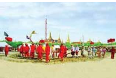
พิธีแรกนาขวัญ