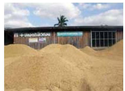
พืชเศรษฐกิจของประเทศไทย

อะไรเป็นปัจจัยสำคัญขับเคลื่อนให้ข้าวไทยกลายเป็นพืชเศรษฐกิจหลักของประเทศนั้น กล่าวได้ว่ามาจากการเปิดประตูการค้ากับประเทศตะวันตก โดยเฉพาะในสมัยของพระจอมเกล้าเจ้าอยู่หัว (2394-2411) เมื่อพระองค์ได้ขึ้นครองราช ก็ได้ดำเนินพระราชโบายเปิดกว้างในทางการค้ากับประเทศตะวันตกซึ่งได้ซบเซามา นับแต่ช่วงปลายกรุงศรีอยุธยา ทั้งนี้ได้เริ่มจากการที่ เซอร์จอห์น เบาริง (Sir John Bowring) ได้เป็นทูตของประเทศอังกฤษได้เข้ามาเจรจาเพื่อเปิดประตูการค้าระหว่างประเทศสยาม 1 ในสมัยนั้นกับประเทศ