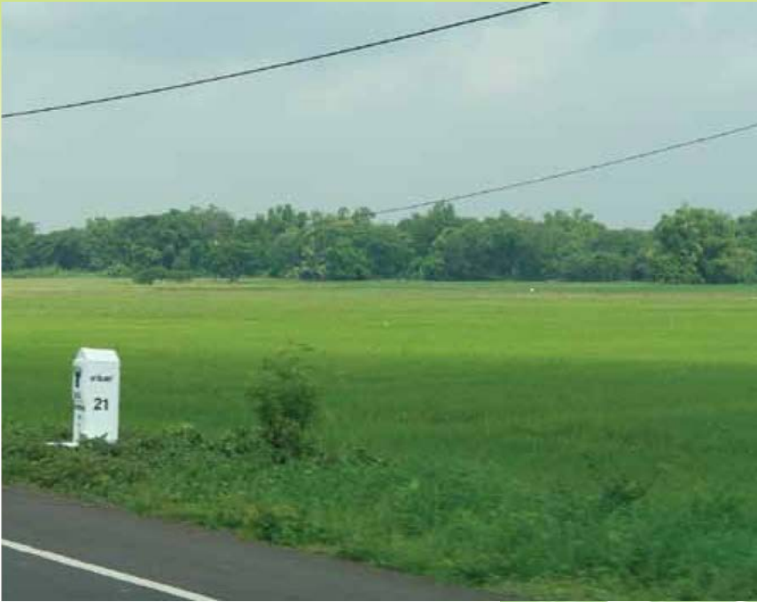
บรรยากาศสองข้างทางระหว่างเดินทาง

พืชเศรษฐกิจที่สมาชิกนิยมปลูกกันมากคือ ข้าว และอ้อย ทางกลุ่มมีกิจกรรมที่ทำร่วมกันคือ ทุกวันที่ 1 ของเดือนสมาชิกจะต้องมาประชุมร่วมกัน และสมาชิกทุกคนต้องออมเงินวันละ 1 บาท เพื่อเป็นเงินออมของกลุ่ม โดยทางกลุ่มจะนำเงินออมดังกล่าวบางส่วนไปซื้ออ้าวเพื่อเป็นสินทรัพย์ร่วมกันของกลุ่มสมาชิก ซึ่งการซื้ออ้าวมาเลี้ยงนั้นจะได้ผลกำไรจากการเพิ่มขึ้นของลูกอ้าวที่คลอดออกมาและการนำมูลอ้าวมาทำปุ๋ยชีวภาพ และที่เห็นผลในตอนนี้คือทางกลุ่มได้ทำการถ่ายโอนหนี้สินของสมาชิกจากสถาบันการเงินแล้ว 59 ราย รอกการโอนหนี้อีก 70 ราย ซึ่งจะทำให้คุณภาพชีวิตของเกษตรกรเริ่มจะมีทิศทางที่ดีขึ้น