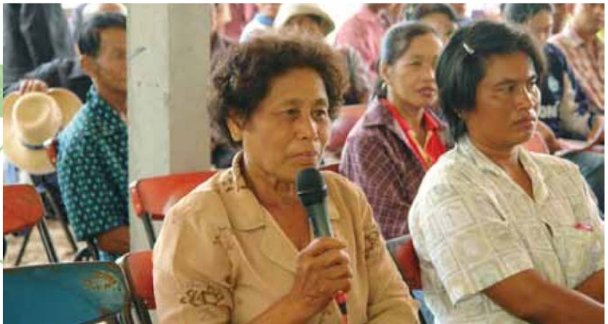
ช่วงเวลาแห่งการซักถามถึงแนวทางการแก้ปัญหาหนี้สินของเกษตรกร