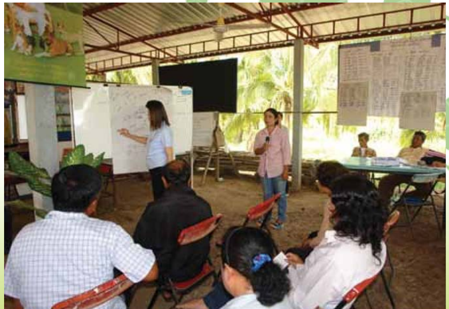
บรรยากาศที่เป็นกันเองในเวทีแลกเปลี่ยนเรียนรู้ระหว่างวิทยากรและสมาชิกกลุ่มเกษตรกร