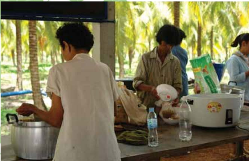
ชาวบ้านคลองใหญ่นำอาหารมาปรุง และรับประทานอาหารกลางวันร่วมกันทุกครั้งที่มีการประชุม

ขึ้นราคา ค่ายารักก็แพงตามหลัง ชาวนา ก็บ่นว่าแยะ ส่วนไอ้พวกเจ้าแกบอ ก่าไรดีจิง ชาวนาเป็นข้าของชาติ หมดโอกาสและวาสนา”