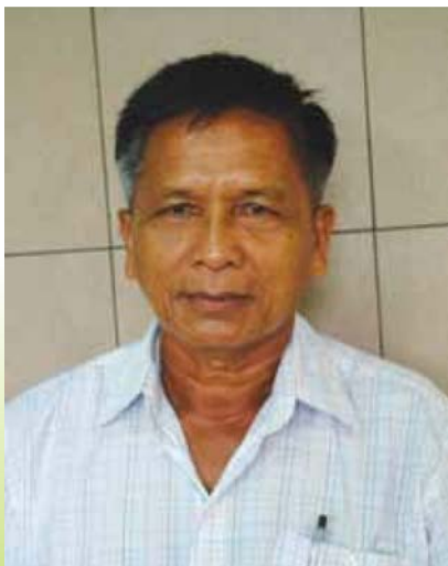
คุณลุงคนเก่ง

มีหนี้สินเพิ่มพูนมากยิ่งขึ้น ซึ่งปัญหาทั้งหมดเหล่านี้ต้องรีบเร่งช่วยกันแก้ไข