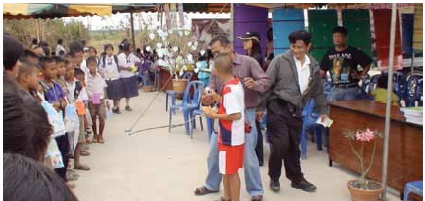
โครงการต้นกล้าพันธุ์ใหม่หัวใจสหกรณ์

สมาชิก จากการพัฒนารูปแบบการดำเนินงานของสหกรณ์สมาชิกมีความศรัทธาและเชื่อมั่นในองค์กรของสหกรณ์มากยิ่งขึ้น สังเกตได้จากการมีส่วนร่วมของสมาชิกในการจัดกิจกรรมต่างๆ ของสหกรณ์ การเข้าร่วมในการทำธุรกิจกับสหกรณ์ทั้งธุรกิจ ตลาด (การจัดหาปุ๋ย วัสดุ อุปกรณ์ทางการเกษตร) ธุรกิจรวบรวมทั้งข้าวและมันสำปะหลัง ธุรกิจสินเชื่อฯ สมาชิกได้ ตระหนักถึงความ เป็นเจ้าของสหกรณ์ การแสดงความคิดเห็นและข้อเสนอแนะแก่ฝ่ายบริหารและฝ่ายจัดการในการปรับปรุงการให้บริการต่างๆ ที่ตอบสนองของความต้องการของสมาชิก สมาชิกได้มีโอกาสพบปะพูดคุยกันมากขึ้น จากการเข้าร่วมกิจกรรมตามประเพณีต่างๆ ที่สหกรณ์ได้จัดขึ้น สมาชิกได้มีการแลกเปลี่ยนความรู้ และให้ความช่วยเหลือระหว่างกัน ซึ่งจะเป็นการสร้างสายใย ความรัก ความสามัคคีของคนในชุมชนและเป็นการรักษาวัฒนธรรมความเป็นอยู่อย่างไทยที่หาได้ยากในปัจจุบัน สมาชิกมีความตื่นตัวในการพัฒนาตนเอง การพัฒนาการทำกิน จากการทำสหกรณ์