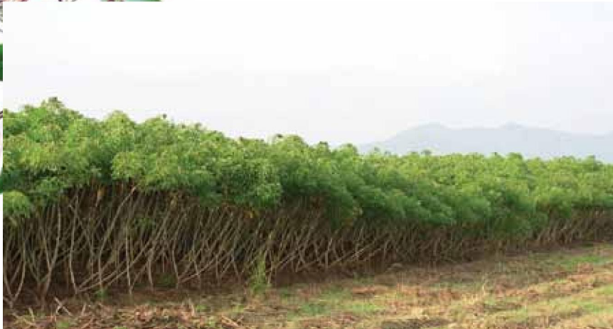
แปลงมันสำปะหลัง