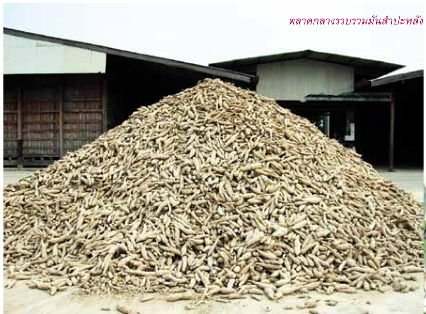
ตลาดกลางรวบรวมมันสำปะหลัง

ประการที่สอง สหกรณ์ได้รับเอาแนวคิดของการเชื่อมโยงเครือข่ายคุณค่าไปพัฒนางานของตน โดยเริ่มจากกระบวนการต้นน้ำ สหกรณ์การเกษตรชาวนวลักษณ์บุรีได้มีการจัด