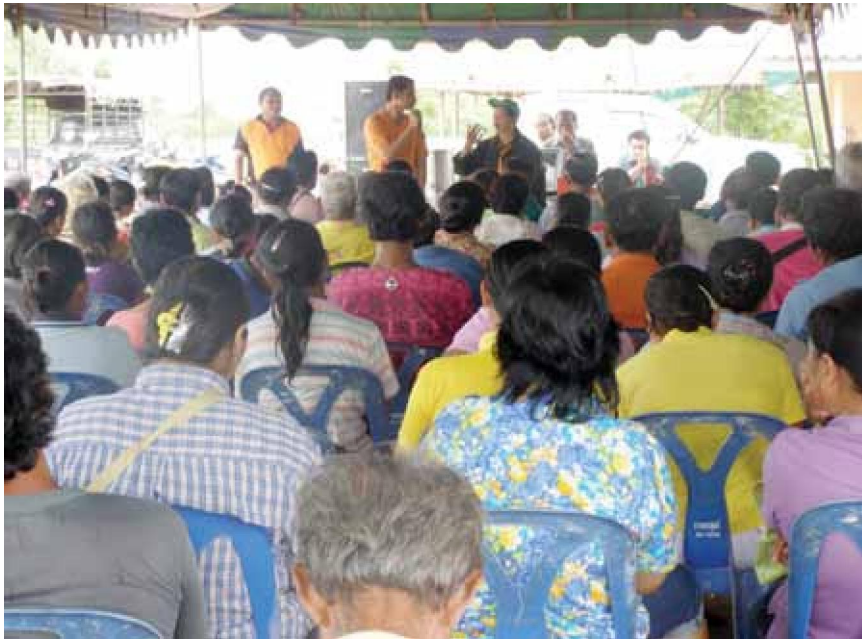
สมาชิกให้ความสนใจเข้าร่วมกิจกรรมสหกรณ์

ตั้งศูนย์ส่งเสริมการเพิ่มผลผลิตและคุณภาพผลผลิตเพื่อการเชื่อมโยงเครือข่ายการตลาด โดยศูนย์ส่งเสริมฯ เป็นหน่วยงานใหม่ของสหกรณ์ที่ได้มีการนำแนวคิดของการจัดการความรู้ (Knowledge management) มาประยุกต์ใช้ โดยการรวบรวมแหล่งความรู้จากแหล่งต่างๆ ที่เกี่ยวข้องกับเกษตร มาเป็นแหล่งให้สมาชิกได้ค้นคว้าศึกษาวิธีการเพาะปลูกสมัยใหม่ที่ช่วยให้เกิดการเพิ่มผลผลิตและการลดต้นทุนการผลิตจากการประสานงานร่วมกับสำนักงานเกษตรอำเภอ นักวิชาการเกษตร ปรชาชนชาวบ้าน สหกรณ์พาหีเครือข่าย ฯ การเผยแพร่ความรู้จากการทำแปลงสาธิตเพื่อให้สมาชิกได้เรียนรู้เชิงประจักษ์ ซึ่งค้นพบว่าได้ผลที่ดีกว่าการจัดฝึกอบรม