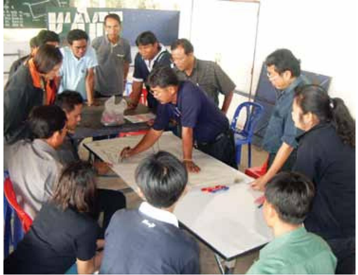
การระดมความคิดเห็นของบุคคล 3 ฝ่าย

และข้อจำกัดต่างๆ ตลอดจนแนวทางแก้ไขที่เป็นที่ยอมรับของทุกฝ่ายก่อนกำหนดเป็นแผนงานที่จะนำไปสู่การปฏิบัติจริง สหกรณ์ได้ตระหนักถึงความสำคัญของ การมีส่วนร่วมของทุกฝ่าย ซึ่งเป็นพื้นฐานที่สำคัญของการดำเนินงานใดๆ เมื่อทุกฝ่ายมีส่วนร่วมรับรู้ถึงปัญหาและข้อจำกัดต่างๆ และวางแผนแก้ไขปัญหาร่วมกันแล้ว โอกาสของแผนงานที่จะนำไปสู่การปฏิบัติก็จะเกิดผลสัมฤทธิ์และประสิทธิภาพที่ดี ซึ่งแตกต่างจากเดิมที่ฝ่ายจัดการและคณะกรรมการไม่ได้ร่วมปรึกษาวางแผนร่วมกันอย่างจริงจังและไม่ได้สำรวจความคิดเห็นเบื้องต้นจากตัวแทนของสมาชิก การกำหนดเป้าหมายและวัตถุประสงค์ของแผนงานที่มุ่งเน้นที่ผลประโยชน์ของสมาชิกมากกว่ากำไรของสหกรณ์เพียงอย่างเดียว ตัวอย่างเช่น สหกรณ์การเกษตรชาวนวลักษณ์บุรีได้มีการเปิดและขยายสาขาของตลาดกลางเพื่อรวบรวมมันสำปะหลังจากสมาชิกเพิ่มขึ้นอีกหนึ่งสาขา เนื่องจากพื้นที่การให้บริการของ