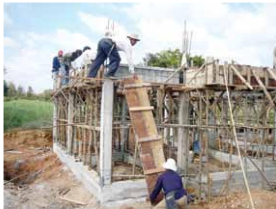
ลูกหลานชาวนาทั้งฝั่งนาไปเป็นลูกจ้างในโรงงานและรับจ้างก่อสร้าง

เด็กรุ่นใหม่ที่เป็นลูกหลานชาวนาเริ่มรู้สึกแปลกแยกกับวัฒนธรรมพื้นบ้าน และวิถีชีวิตของสังคมชาวนาดั้งเดิม ลัทธิบริโภคนิยมเข้ามาแทนที่ การกินอยู่อย่างเรียบง่าย นอกจากนี้ยังพบว่าปรากฏการณ์คนหนุ่มสาวทั้งฝั่งนาหลังไหลเข้าสู่ประตูโรงงานเพิ่มขึ้นเพื่อหวังรายได้และความเป็นอยู่ที่มั่นคง สะดวกสบาย ภาคเกษตรกรรมอันเป็นรากฐานของวัฒนธรรมชาวนากำลังถูกทอดทิ้งจากเด็กรุ่นใหม่ที่เป็นลูกหลานชาวนาเอง แต่กลับหมดศรัทธาต่ออาชีพของครอบครัวที่มีมาแต่เดิม นอกจากนี้ ในสังคมชาวนาที่เปลี่ยนแปลงไปนี้ยังมีปัญหาสังคมตามมามากขึ้น เช่น ปัญหาความแตกแยกในครอบครัว ปัญหายาเสพติด ปัญหาทางเพศ ปัญหาอาชญากรรม ฯลฯ สำนึกความเป็นชุมชนเริ่มลดน้อยถอยลง สถาบันชุมชนไม่ว่าจะเป็นโรงเรียน วัด และกลุ่มสังคมต่างๆ เริ่มสั่นคลอน และไม่อาจตอบสนองการเปลี่ยนแปลงที่เกิดขึ้นได้ (ยศ สันตสมบัติ, 2539)