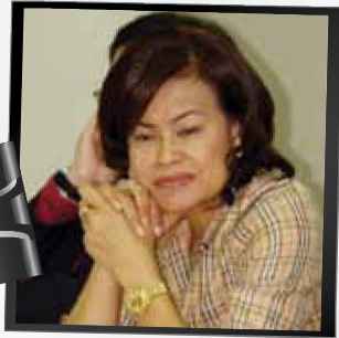
ผู้เชี่ยวชาญบริษัท เปรมประพันธ์