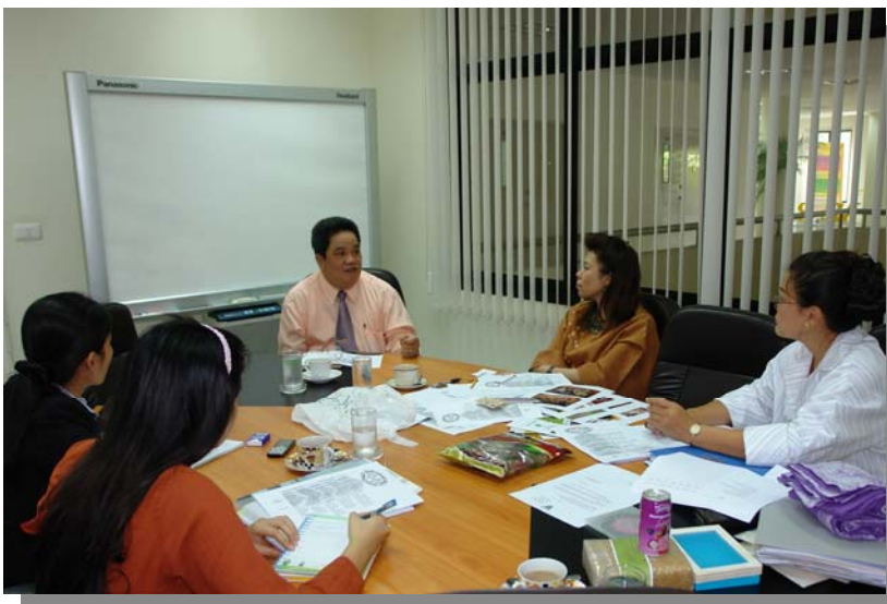
รูปที่ 7 : ประชุมกับชุมนุมร้านสหกรณ์แห่งประเทศไทย จำกัด