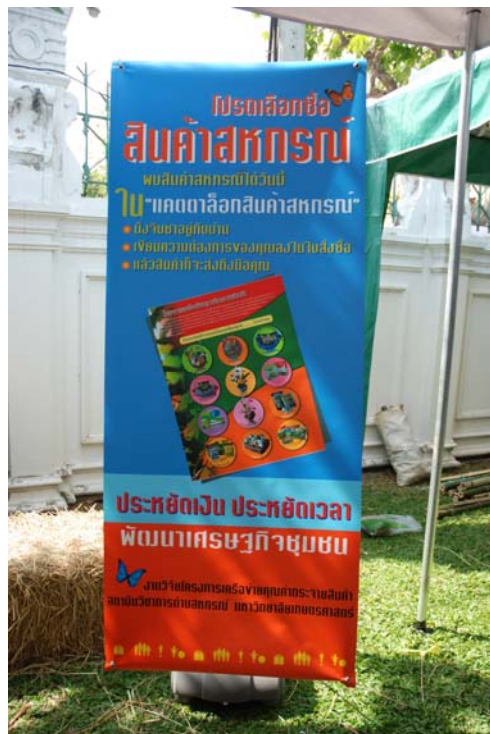
รูปที่ 11 : แผ่นภาพประชาสัมพันธ์

นำแผ่นภาพไปประชาสัมพันธ์ในงานเพื่อไทย พันภัย ฟังใจ เพื่อนฟัง(ภาฯ) ณ ตำบลสวนกุหลาบ และงานอร่อยทั่วไทยกับไปรษณีย์ บริษัทไปรษณีย์ไทย จำกัด