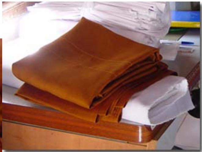
รูปที่ 12 : ชุดผ้าไตรจักรย้อมสีธรรมชาติ