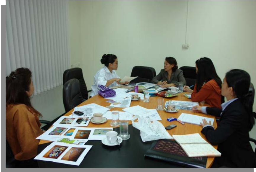
รูปที่ 8 : ประชุมกับฝ่ายการพิมพ์ โรงพิมพ์ชุมนุมสหกรณ์การเกษตรแห่งประเทศไทย