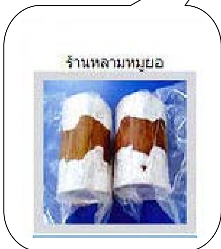
รูปที่ 4