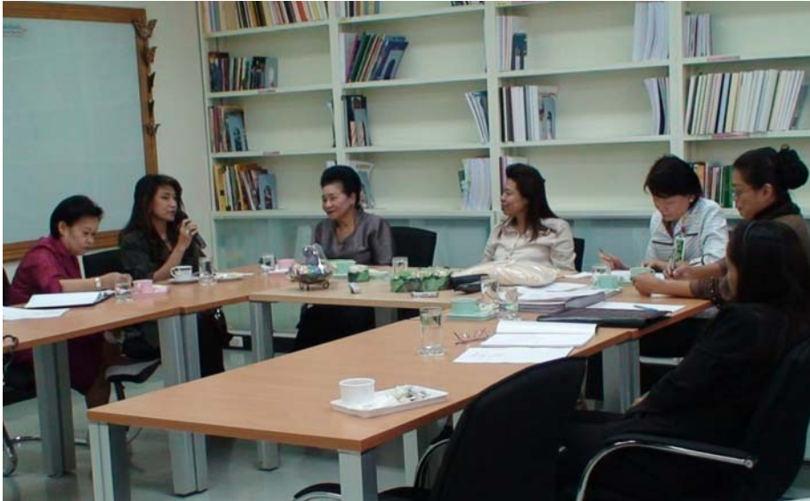
รูปที่ 10 : ร่วมประชุมหารือการขับเคลื่อนเครือข่ายสตรีสหกรณ์ จากสหกรณ์ออมทรัพย์ การไฟฟ้าฝ่ายผลิตแห่งประเทศไทย/สหกรณ์ออมทรัพย์ มหาวิทยาลัยธุรกิจบัณฑิตย์/สหกรณ์ออมทรัพย์ กรมอนามัย /ออมทรัพย์ มหาวิทยาลัยเกษตรศาสตร์