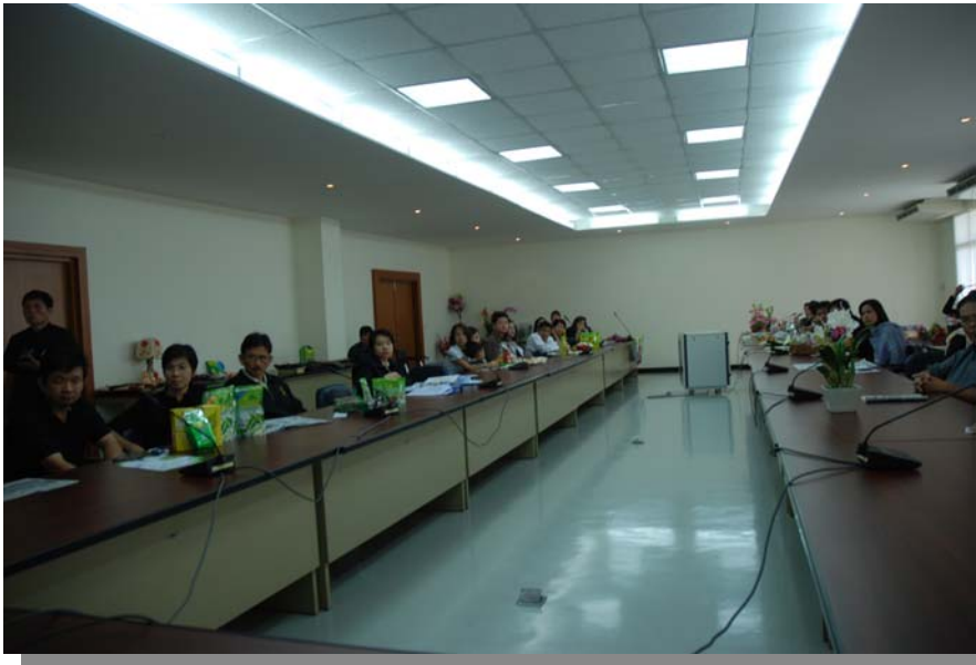
รูปที่ 9 : ประชุมคัดสรรสินค้าจากกลุ่มสหกรณ์จังหวัดต่างๆ