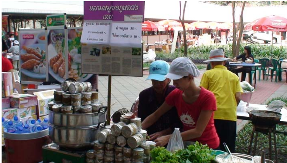
รูปที่ 3 : กลุ่มวิสาหกิจชุมชนแปรรูปเนื้อสัตว์ จ.เลย ในงานอร่อยทั่วไทยกับไปรษณีย์ ที่ ปฉท.

ของ กลุ่มวิสาหกิจชุมชนแปรรูปเนื้อสัตว์ จ.เลย