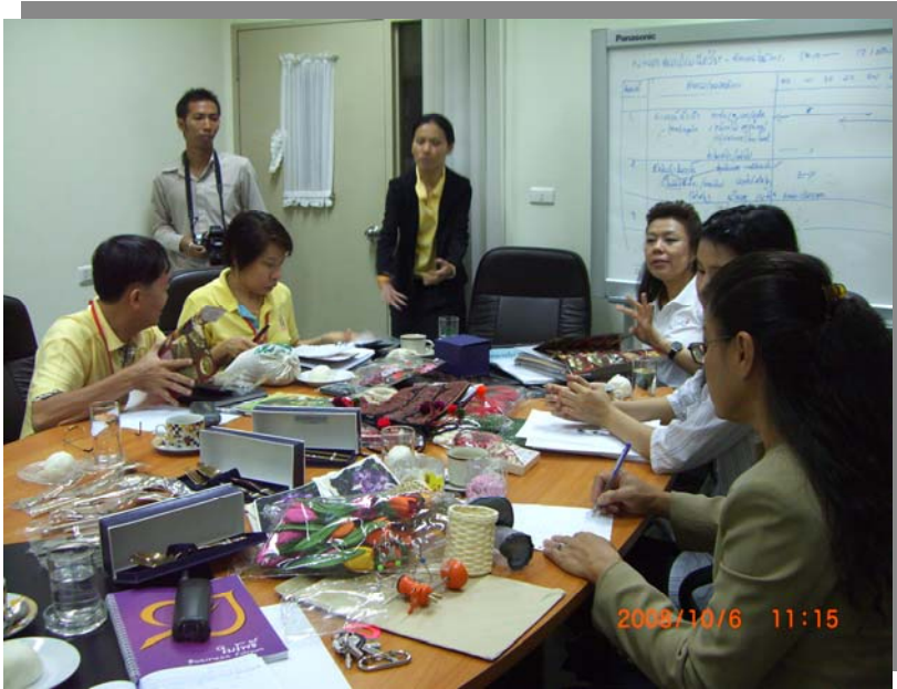
รูปที่ 6 : ประชุมกับบริษัท ไปรษณีย์ไทย จำกัด