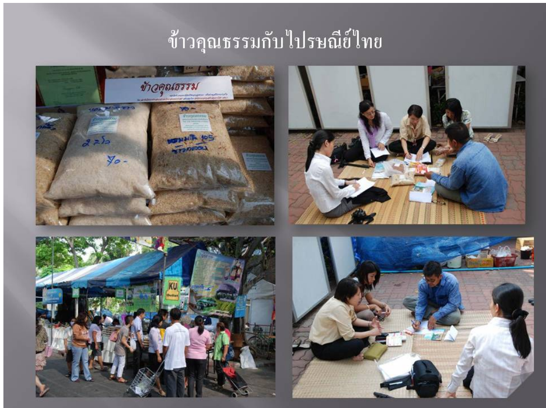
รูปที่ 5 : ห้าเครือข่ายคุณธรรมเข้าโครงการ “อร่อยทั่วไทยกับไปรษณีย์”