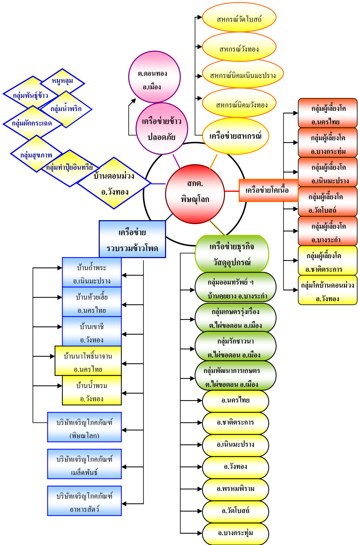
รูปที่ 4 ภาพการต่อยอดเครือข่าย

สีเหลือง คือ เครือข่ายที่เข้ามาเป็นสมาชิกใหม่