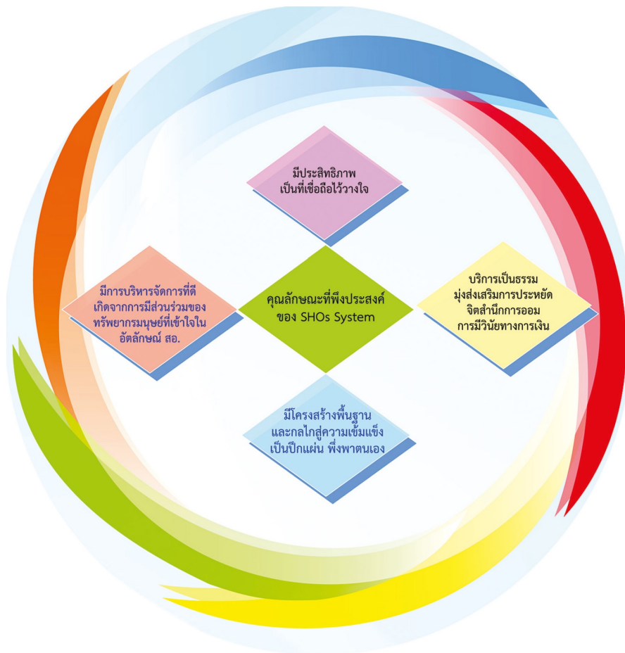
คุณลักษณะที่พึงประสงค์ของ SHO System

มาตรฐานสากล เพื่อภาพลักษณ์เป็นที่เชื่อ มั่นไว้วางใจ