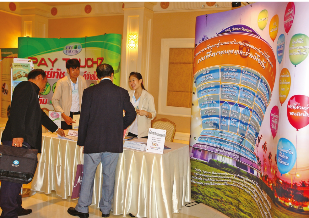
จัดบูทเพื่อเผยแพร่ SHOs System ในที่ประชุมใหญ่ชสอ. ประจำปี 2555

ในปี พ.ศ. 2554 คณะกรรมการดำเนินการ ชสอ. ชุดที่ 38 ได้เล็งเห็นความสำคัญของการขับเคลื่อนยุทธศาสตร์การพัฒนาระบบการเงินที่เอื้อต่อการพึ่งพาตนเองและร่วมมือกันระหว่างสหกรณ์ : SHOs System ซึ่งเป็นยุทธศาสตร์หนึ่งในห้าประเด็นยุทธศาสตร์ ภายใต้แผนพัฒนาการสหกรณ์ ฉบับที่ 2 (พ.ศ. 2550-2554) จึงได้มอบหมายให้ทีมวิจัยของสถาบันวิชาการด้านสหกรณ์ คณะเศรษฐศาสตร์ มหาวิทยาลัยเกษตรศาสตร์ ดำเนินการโครงการวิจัยดังกล่าว ซึ่งผลการวิจัยได้นำเสนอคุณสมบัติที่พึงประสงค์ของ SHOs System และกรอบแนวทางการดำเนินงาน SHOs System และมาตรการดำเนินการทั้งสิ้น 15 มาตรการ โดยคณะกรรมการดำเนินการ ชสอ. ชุดที่ 39 ได้นำประเด็นของ SHOs System บรรจุไว้ในแผนกลยุทธ์ ระยะที่ 3 ของ ชสอ. และได้มีการเผยแพร่แนวคิด SHOs System ในที่ประชุมใหญ่ ชสอ. ประจำปี 2555 อีกทั้งการประชุมแลกเปลี่ยนความคิดเห็นในที่ประชุมสัมมนาผู้บริหาร - ฝ่ายจัดการ อย่างต่อเนื่อง