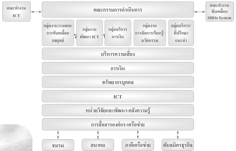
โครงสร้างการบริหารงาน ชสอ.