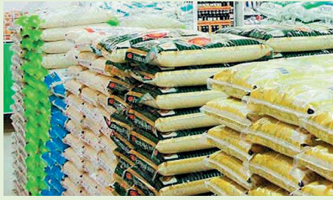
ข้าวหอมมะลิบรรจุถุง

การที่ข้าวหอมมะลิมีอุปทานของผลผลิตจำกัดในรอบปี อีกทั้งเกษตรกรจำนวนหนึ่งจะทยอยนำข้าวเปลือกจากยุ้งฉางที่เก็บไว้ออกขายเมื่อต้องการใช้เงิน ทำให้การรวบรวมข้าวหอมมะลิของตลาดเอกชนยังสามารถทำงานได้บ้าง แม้จะต้องแข่งขันด้านราคาที่สูงกับโครงการรับจำนำของรัฐที่ให้ราคาสูงถึงตันละ 20,000 บาทก็ตาม ทั้งนี้เพราะเกษตรกรที่ขายข้าวให้เอกชนแม้จะได้อะไรก็ตามต่ำกว่าบ้าง แต่จะได้รับเงินสดทันทีไม่ต้องรอเหมือนกับการขายผ่านโครงการรับจำนำของรัฐ ซึ่งเกษตรกรไม่