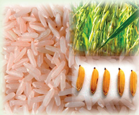
คุณสมบัติจำเพาะของข้าวหอมมะลิที่ผู้บริโภคควรรู้

สามารถรอคอยได้เพราะมีความต้องการใช้เงินไปใช้จ่ายใช้สอยในครอบครัวรวมถึงการใช้หนี้เงินกู้ เป็นต้น