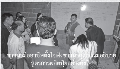
ชาวบ้านอโรคยาตั้งใจฟังชาวนาคุณธรรมอธิบายสูตรการผลิตปุ๋ยอย่างคั่งเจ

ถัดไปอีกไม่ไกลจากโรงสีมากนักเป็นโรงผลิตปุ๋ยอินทรีย์ของเครือข่าย ผู้เขียนเองก็ต้องตะลึงกับปริมาณปุ๋ยที่ตั้งเรียงรายซ้อนกันเป็นจำนวนมากเป็นร้อยๆ ถุง เป็นปุ๋ยที่ทางเครือข่ายผลิตและจำหน่ายใช้กันเองภายในเครือข่าย กลิ่นแฉะที่เกิดจากปุ๋ยฟุ้งตกลงบอบอวนไปทั่ว ได้ยินเสียงแฉะๆ จากใครสักคนบอกว่ากลิ่นเหมือนขี้ค่างควาเลย ผู้เขียนก็ไม่เคยดมขี้ค่างควาก็เลยคิดตามไปเลยคงจะกลิ่นแบบปุ๋ยอินทรีย์นี่กระมัง มองไปที่ข้างฝาโรงปุ๋ยเห็นมีบอร์ดอธิบายวิธีการผสมส่วนผสมต่างๆ ของการทำปุ๋ยอินทรีย์ของเครือข่าย ข้างโรงปุ๋ยมีแปดฝักขนาดย่อม เขียวแตกใบงามจริงๆ มีทั้งฝักคะน้า ต้นหอม และมะระ