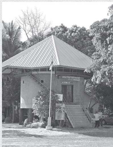
ภาพธนาธิยาการ สำหรับเก็บเมล็ดพันธุ์ข้าวของเครือข่าย

5 ปีผ่านไปทางเครือข่ายคุณค่าชาวนาคุณธรรมก้าวข้ามข้อจำกัดพื้นฐานทางการประกอบอาชีพชาวนาไปแล้วเป็นกลุ่มชาวนาที่มีความเข้มแข็งพร้อมที่จะปกป้องศักดิ์ศรีอาชีพชาวนาของตนเองอย่างภาคภูมิใจ ผู้เขียนไม่ได้อ้างขึ้นลอยๆ แต่เขียนด้วยข้อมูลที่ได้สัมผัส ได้ไปเห็นมาด้วยตัวเอง ก้าวแรก