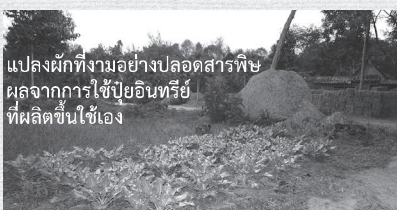
แปลงผักที่งามอย่างปลอดสารพิษ ผลจากการใช้ปุ๋ยอินทรีย์ที่ผลิตขึ้นใช้เอง