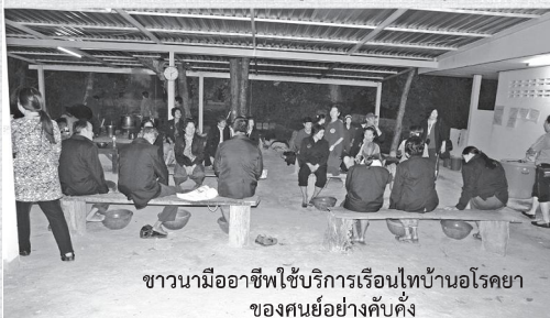
ชาวบ้านอโรคยาใช้บริการเรือนที่บ้านอโรคยาของศูนย์อย่างคับคั่ง