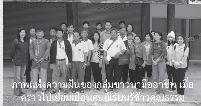
ภาพแห่งความฝันของกลุ่มชาวบ้านอโรคยา เมื่อคราวไปเยี่ยมเยือนศูนย์เรียนรู้ชาวนาคุณธรรม

ขึ้นก คงไม่ต้องบรรยายทำไมถึงงามขนาดนี้ ระหว่างทางที่เดินพวกเราได้พบแปลงผักสวนครัวย่อยๆ ปลูกผักแต่ละชนิดไม่มากนัก แต่หลากหลายชนิดล้วนพื้นฐานเอาเองว่าปลูกไว้กินเองในครัวเรือนในเครือข่าย มีกองฟางตั้งเรียงอยู่ได้ข้อมูลว่าที่นี้ให้ความสำคัญกับกองฟางมาก จนมีคำกล่าวให้มีความสำคัญว่ามีฟางเหมือนมีทอง เพราะที่ไฮดรอน้ำแล้งจะแล้งมาก ต้องประหยัดน้ำ ฟางข้าวจะช่วยดูดรับความชื้นได้ดี ทั้งจากน้ำค้างตอนกลางคืนและน้ำที่ตกลงไป