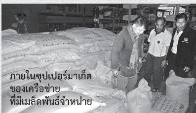
ภายในซูเปอร์มาร์เก็ตของเครือข่ายที่มีเมล็ดพันธุ์จำหน่าย