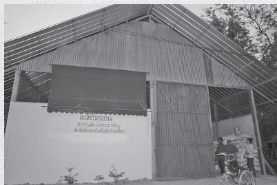
โรงสีดาวกระจายของศูนย์ที่ช่วยลดต้นทุน