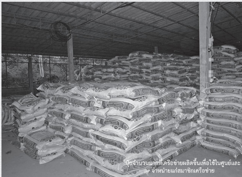
ปุ๋ยจำนวนมากที่เครือข่ายผลิตขึ้นเพื่อใช้ในศูนย์และจำหน่ายแก่สมาชิกเครือข่าย

ช่วยลดต้นทุนได้หลายอย่าง โดยเฉพาะการลดต้นทุนการขนส่งข้าวเปลือกไปแปรรูปที่เดียวเมื่อเปรียบเทียบกับกรณีมีโรงสีของเครือข่ายเพียงแห่งเดียว ซึ่งจากเดิมเครือข่ายชาวนาคุณธรรมทั้ง 4 จังหวัด ต้องขนข้าวเปลือกไปที่โนนค้อทุ่งเพียงแห่งเดียว ล่าสุดผู้เชี่ยวชาญมาว่ามีผู้ใหญ่ใจดีได้ช่วยเหลืองบประมาณการก่อสร้างโรงเรือน และเครื่องสีข้าวขนาดเล็กจำนวนทั้งสิ้น 7 โรง กระจายตัวรอบพื้นที่ 4 จังหวัด เพื่อให้พี่น้องสมาชิกชาวนาคุณธรรมได้แปรรูปผลผลิตใกล้บ้าน