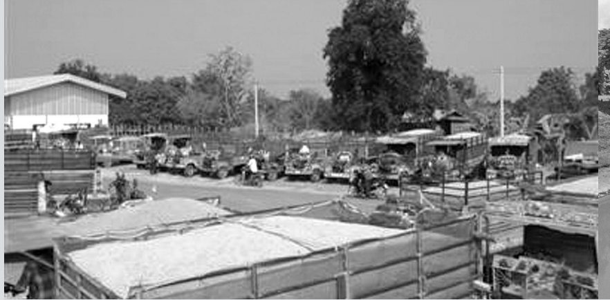
เกษตรกรนำข้าวเปลือกมาเข้าร่วมโครงการรับจำนำในปริมาณมาก

กล่าวได้ว่าโครงการรับจำนำได้ส่งผลให้รัฐเป็นผู้ซื้อรายใหญ่ในตลาดข้าวเปลือกและได้ตัดทอนบทบาทของกลไกตลาดกลางข้าวเปลือกของเอกชนและของสหกรณ์การเกษตรที่ได้เคยพัฒนาปรับปรุงกันไว้ในอดีตต้องเลิกกิจการไป ในอดีตตลาดกลางข้าวเปลือกจัดเป็นกลไกที่สำคัญในการสร้างอำนาจการต่อรองทางการตลาดให้กับเกษตรกรทั้งขนาดเล็กและขนาดใหญ่ ที่นำผลผลิตมาซื้อขายในตลาด ทั้งนี้จะมีการซื้อขายกันตามคุณภาพของข้าว ข้าวที่มีคุณภาพดีก็จะได้ราคาที่สูงขึ้น ข้าวที่มีคุณภาพรองลงมาก็จะได้ราคาลดหลั่นลงมา ในขณะที่โรงสีก็จะส่งตัวแทน