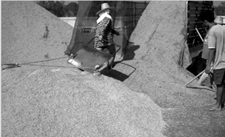
เกษตรกรเร่งปลูกข้าวเพื่อเข้าร่วมโครงการรับจำนำส่งผลให้ข้าวมีคุณภาพต่ำ

โรงสีจะชั่งน้ำหนักและวัดความชื้นให้กับตนเองอย่างยุติธรรมหรือไม่ นอกจากนี้โรงสียังเป็นผู้ทำหน้าที่รับจ้างฝากข้าวภายใต้โครงการรับจำนำ รวมถึงการเป็นผู้รับจ้างสีข้าวให้กับภาครัฐ เป็นต้นทั้งนี้ยังไม่รวมถึงโอกาสที่จะเกิดจากการทุจริตในรูปแบบต่างๆ เช่น การสวมสิทธิ์ การหมุนเวียนข้าวไปขาย ดังที่เคยเกิดขึ้นในอดีต เป็นต้น