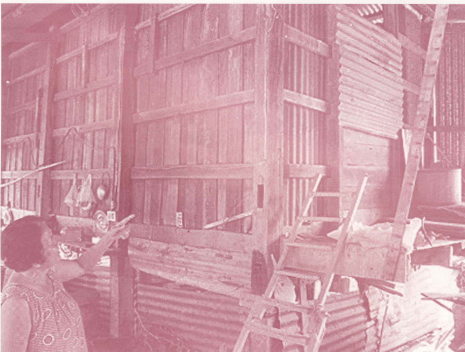
การรับจำนำข้าวเปลือกในยุ้งฉางเกษตรกร

โครงการรับจำนำข้าวเปลือกมาปรังปี 2544 ถือได้ว่าเป็นต้นแบบของโครงการจำนำไปประทวนต่อเนื่องมาจนถึงปีการผล 2551/52 (ที่ได้ปรับเปลี่ยนนโยบายไปเป็นโครงการประกันรายได้ขั้นต่ำในรัฐบาลพรรคประชาธิปัตย์) ทั้งนี้รัฐบาลได้เพิ่มราคาเป้าหมายของการรับจำนำให้สูงกว่าระดับรา