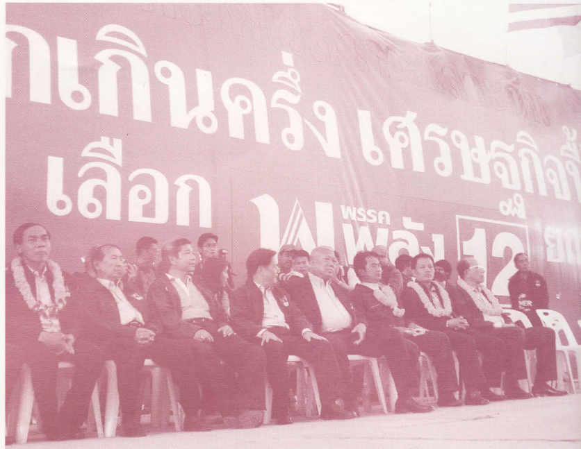
ในช่วงเวลาของพรรคพลังประชาชนเป็นรัฐบาล

ในจำนวนที่มากขึ้นไปจากเดิมกว่าที่เคยเป็นมา ในช่วงปลายปี 2549 ได้มีการเปลี่ยนแปลงรัฐบาลจากพรรคไทยรักไทยเป็นรัฐบาลชั่วคราวซึ่งมีพลเอกสุรยุทธ์ จุลานนท์ เป็นนายกรัฐมนตรี การดำเนินโครงการรับจำนำข้าวเปลือกในฤดูนาปีปีการผลิต 2549/50 ของรัฐบาลในขณะนั้นยังดำเนินเหมือนกับปีที่ผ่านมา แต่ได้ปรับลดเป้าหมายปริมาณการรับจำนำลงจาก 9 ล้านตันมาเป็น 8 ล้านตัน ทั้งนี้เพื่อให้เป็นไปตามยุทธศาสตร์ข้าวไทย 3 พร้อมกับปรับราคารับจำนำเป้าหมายในฤดูนาปีให้ใกล้เคียงกับราคาตลาด พร้อมกับมีการจัดทำแผนการระบายข้าวในสต็อกออกเป็นระยะและสามารถระบายข้าวสารคงเหลือในสต็อกได้ลดลงเหลือเพียงจำนวน 2.1 ล้านตัน