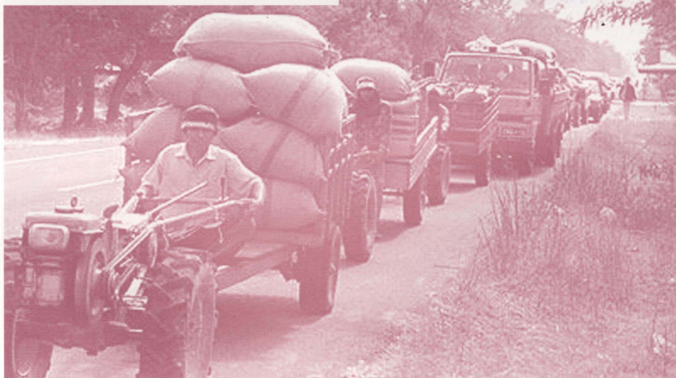
ปัญหาราคาข้าวตกต่ำ

ภาวะตกต่ำของราคาข้าวโดยเฉพาะในช่วงเวลาเก็บเกี่ยวซึ่งเกษตรกรที่ขาดแคลนเงินทุนจำต้องเร่งขายข้าวในทันทีภายหลังการเก็บเกี่ยว ทำให้รัฐต้องเข้าไปแทรกแซงกลไกราคาในตลาดข้าวเปลือก เพื่อยกระดับราคาฟาร์มให้สูงขึ้น ในช่วงระหว่างปี 2519-2523 รัฐบาลได้ใช้มาตรการพยุhargaโดยให้องค์การตลาดเพื่อเกษตรกร (อตก.) ทำหน้าที่รับซื้อข้าวเปลือกเพื่อพยุhargaไม่ให้ตกต่ำจนเกินไป