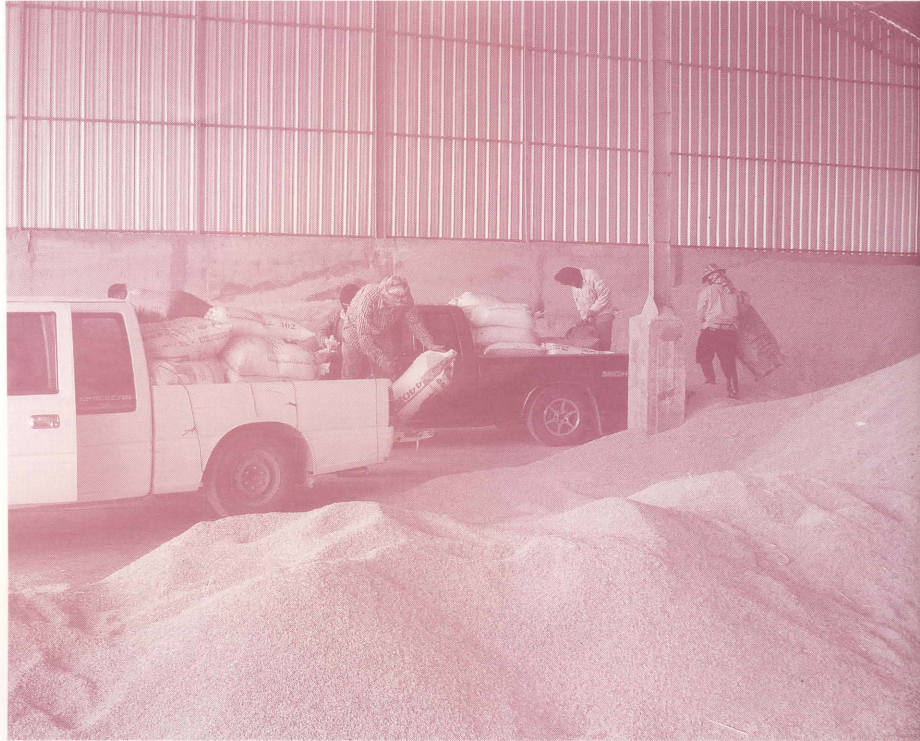
เกษตรกรเข้าร่วมโครงการรับจำนำ

การเปลี่ยนแปลงโครงการรับจำนำข้าวเปลือกในฤดูกาลผลิตปี 2529/30 นับเป็นก้าวสำคัญเพราะได้เปลี่ยนแปลงจากโครงการเสริมมาเป็นโครงการหลัก ทั้งนี้ รัฐบาลได้ผลักดันให้ ธ.ก.ส.เข้ามามีบทบาทในการรับจำนำข้าวเปลือกจำนวนมากเป็นครั้งแรก เพื่อรักษาระดับราคาข้าวไม่ให้ตกต่ำโดยการชลอการขายของเกษตรกร ต่อมารัฐได้เปลี่ยนแปลงจำนวนเงินกู้ที่เกษตรกรได้รับจากร้อยละ 80 เป็นไม่เกินร้อยละ 95 ของราคาเป้าหมาย และให้