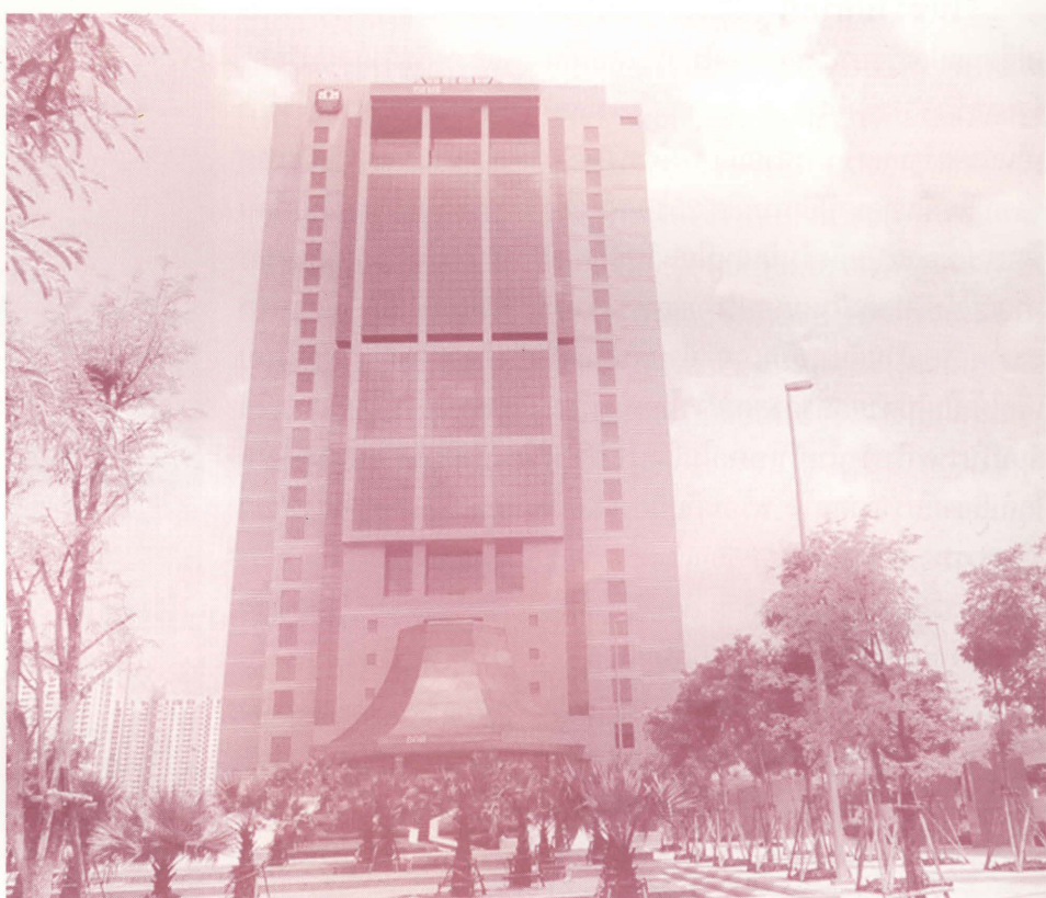
ธ.ก.ส. ได้รับมอบหมายจากรัฐให้ดำเนินโครงการรับจำนำข้าวเปลือกจากเกษตรกร