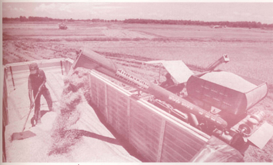
เกษตรกรขายข้าวทันทีหลังจากเก็บเกี่ยวจากแปลงนา เนื่องจากขาดแคลนเงินทุน

โครงการรับจำนำข้าวเปลือกในระยะเริ่มแรกเป็นโครงการเสริมและเป็นโครงการขนาดเล็ก โดยเปิดโอกาสให้เกษตรกรที่ต้องการใช้เงินในต้นฤดูการเก็บเกี่ยวได้นำข้าวมาจำนำไว้เป็นหลักประกันและเพื่อลดอุปทานข้าวที่จะเข้าสู่ตลาดในช่วงฤดูเก็บเกี่ยวจำนวนมากได้ชลดตัวลง ทั้งนี้เกษตรกรที่เข้าร่วมโครงการจะได้รับเงินกู้ยืมไม่เกินร้อยละ 80 ของมูลค่าข้าวเปลือก