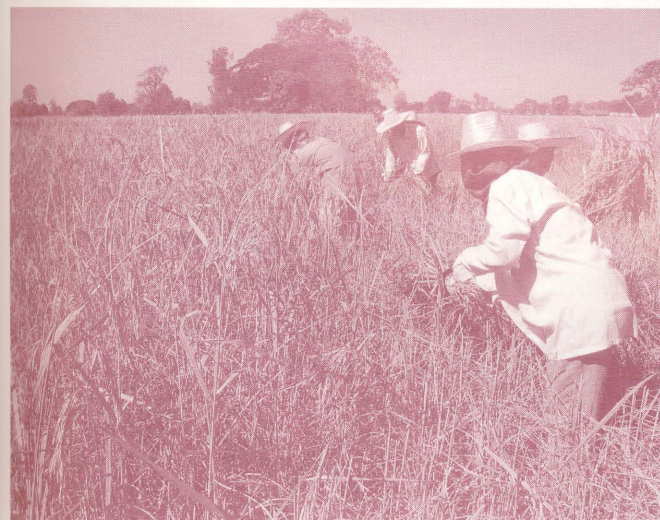
เกษตรกรเพิ่มรอบการเพาะปลูกโดยไม่คำนึงถึงคุณภาพข้าว

ประยุกต์ได้รายงานไว้ว่า นับจากมีการปรับเปลี่ยนรูปแบบโครงการรับจำนำข้าวเปลือกไปสู่การแทรกแซงกลไกตลาดในรูปแบบของการประกันราคาขั้นต่ำ ทำให้มีการเปลี่ยนแปลงในช่วงทางตลาดข้าวจากเดิมที่เกษตรกรขาย ผ่านพ่อค้าในหมู่บ้านและตลาดกลาง ไปสู่การขายผ่านโรงสีเป็นสำคัญ 4