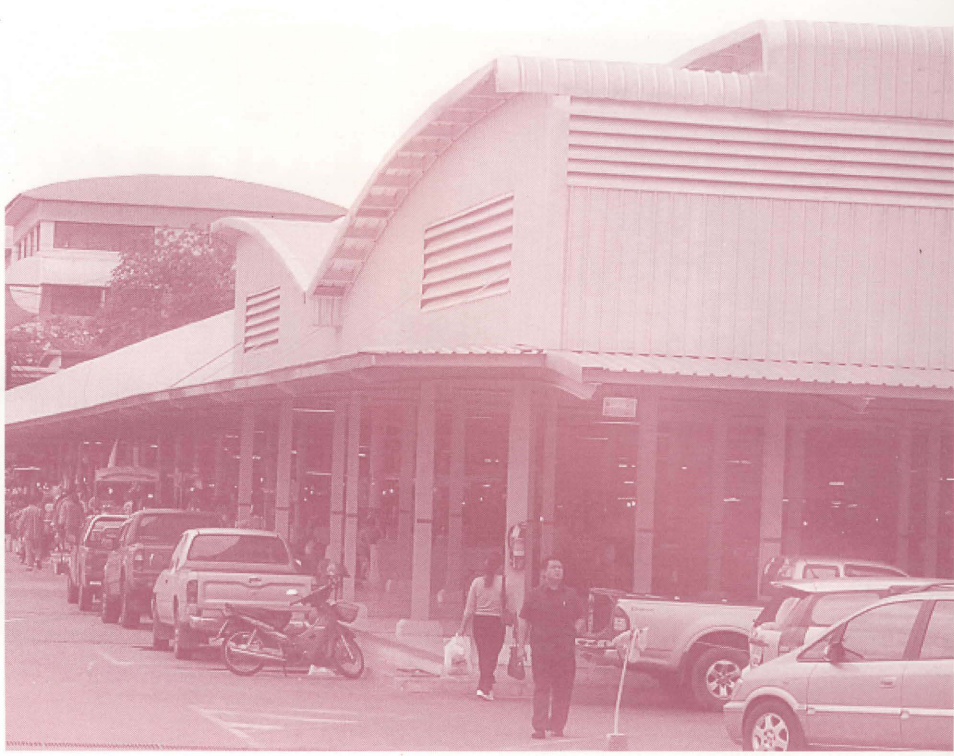
องค์การตลาดเพื่อเกษตรกร(อตก.)

การปรับเพิ่มราคารับจำนำดังกล่าวได้ส่งผลให้เกษตรกรนำข้าวเปลือกที่ผลิตได้มาเข้าโครงการรับจำนำสูงมากขึ้นจาก 2.7 ล้านตันในปีการผลิตปี 2546/47 เป็น 9.4 และ 9.5 ล้านตัน ในปีการผลิต 2547/48 และปีการผลิต 2548/49 ตามลำดับ พร้อมกับมูลค่าการรับจำนำได้เพิ่มจาก 12,429 ล้านบาท ในปีการผลิต 2546/47 เป็น 71,773 ล้านบาท ในปีการผลิต 2548/49 ในขณะที่ขณะเดียวกันการมาไล่ถอนคืนของเกษตรกรกลับลดน้อยลง เป็นผลให้ข้าวหลุดจำนำตกเป็นของรัฐ