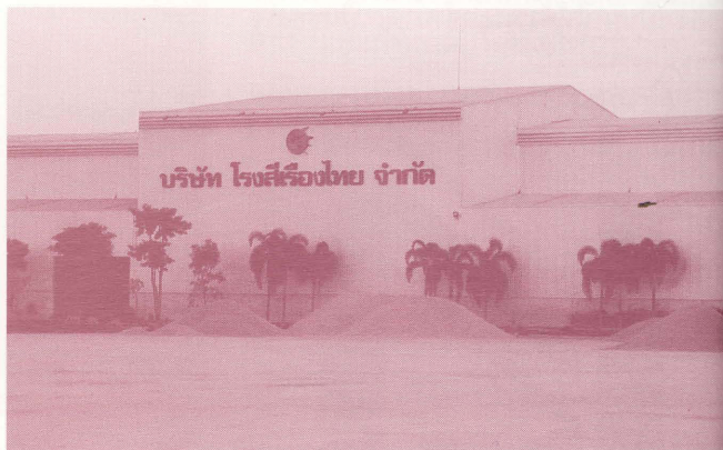
การประกันราคาขึ้นต่ำผ่านโรงสี