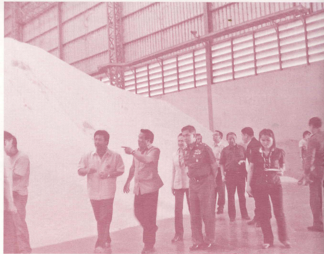
ปริมาณข้าวเปลือกจำนวนมากจากโครงการรับจำนำ

อย่างมากอันเนื่องจากสถานการณ์วิกฤตอาหารและพลังงานโลกพร้อมกับการปรับตัวของราคาข้าวเปลือกในประเทศที่ระดับฟาร์ม ในเดือนมิถุนายน 2551 เกษตรกรได้เรียกร้องให้รัฐบาลประกาศราคารับจำนำในฤดูนาปี 2551 ให้เท่ากับราคาตลาดซึ่งในขณะนั้นราคาข้าวเปลือกที่ระดับฟาร์มได้ขึ้นไปสูงถึงตันละ 15,000 บาท ทำให้มีการปรับราคารับจำนำข้าวเปลือกนาปี ความชันไม่เกิน 15% ไปที่ตันละ 14,000 บาท หรือราคาเพิ่มสูงขึ้นถึงร้อยละ 97.18 ในขณะที่เกษตรกรในพื้นที่ชลประทานมีต้นทุนเฉลี่ย