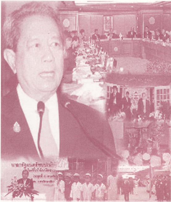
รัฐบาลชั่วคราวในสมัยพลเอกสุรยุทธ์ จุลานนท์